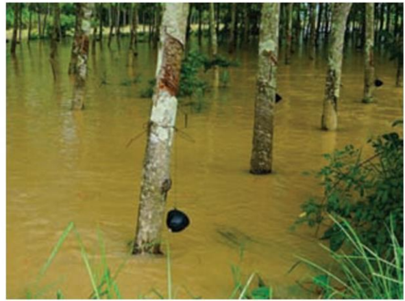
เกษตรกรชาวสวนยางกำลังได้รับความเดือดร้อนอย่างหนักจากราคาที่ตกต่ำเป็นประวัติการณ์

ผลพวงจากกรณีราคา “สินค้าทางการเกษตร” ที่กำลังตกต่ำอยู่ในเวลานี้ ได้กลายเป็นปัญหาที่สร้างความบริวิตกให้กับรัฐบาล “พล.อ.ประยุทธ์ จันทร์โอชา” เป็นอย่างยิ่ง โดยเฉพาะ “ยางพารา ปาล์มน้ำมัน” ซึ่ง “ราคาต่ำ” จนเกษตรกรไม่สามารถอดทนต่อไปได้ และลุ่่มเสี่ยงที่จะกลายเป็นประเด็นที่นำไปสู่ “การเคลื่อนไหว” หรือ “มีอบ” มากขึ้นทุกขณะ