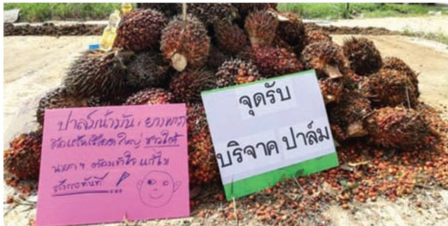
ชาวสวนปาล์มที่รวมตัวกันเรียกร้องให้รัฐบาลเร่งแก้ปัญหา

เห็นชอบมาตรการแก้ไขปัญหาราคापาล์มน้ำมันตกต่ำ โดยมอบหมายให้กระทรวงพลังงานนำน้ำมันปาล์มดิบไปใช้ในการผลิตกระแสไฟฟ้าในโรงไฟฟ้าที่มีศักยภาพจำนวน 1.6 แล่นตัน พร้อมทั้งขยายระยะเวลาการชดเชยค่าขนส่งในการส่งออกน้ำมันปาล์มดิบที่จะสิ้นสุดปลายเดือน พ.ย. 2561 ออกไปอีก 6 เดือน เป็นสิ้นเดือน พ.ค. 2562