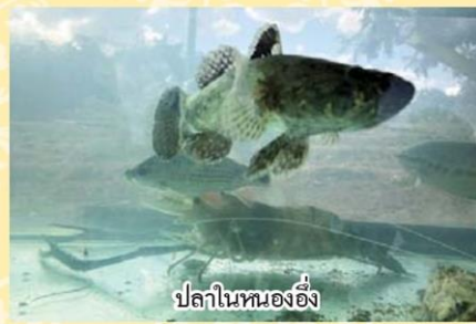
ปลาในหนองอึ่ง

“เราส่งเสริมแบบบูรณาการทุกๆ ด้าน ไม่ว่าจะเป็นเกษตร ประมง และปศุสัตว์ ทำให้ชาวบ้านมีการกินอยู่ที่ดีขึ้น ส่วนด้านสังคม ชุมชนมีความเข้มแข็ง จากเมื่อก่อนต่างคนต่างอยู่ก็ร่วมมือกันและให้ความร่วมมือกับทางการเป็นอย่างดี ถือว่าโครงการพระราชดำรินี้ทำให้ชาวบ้านทั้ง 7 หมู่บ้านมีความเข้มแข็ง และสมัครสมาน