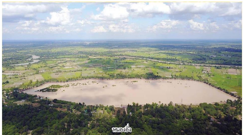
หนองอึ่ง

ในกรณี สมเด็จพระเจ้าอยู่หัว มีพระราชดำริให้มีการพัฒนาและปรับปรุงพื้นที่โดยรวม ได้แก่ การขุดลอกหนองอึ่งเพื่อเป็นแหล่งน้ำทำการเกษตรและขยายพื้นที่ปลูก การปรับปรุงสภาพดินโดยรอบหนองอึ่ง โดยปลูกต้นไม้และหญ้าแฝก