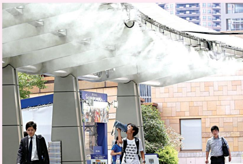
โลกร้อน...ประชาชนสัญจรผ่านพัดลมไอน้ำที่อยู่บริเวณทางเดินด้านนอกอาคารแห่งหนึ่งในกรุงโตเกียว ซึ่งสภาพอากาศร้อนจัดเป็นประวัติการณ์ในญี่ปุ่นนอกจากจะทำให้มีผู้เสียชีวิตมากกว่า 80 ราย แล้วเฉพาะในเดือน ก.ค. ยังส่งผลให้สินค้าเกษตรมีราคาแพงขึ้นด้วย ขณะที่เกาหลีใต้เผชิญกับอิทธิพลรุนแรงของคลื่นความร้อนเช่นกัน มีผู้เสียชีวิตแล้ว 14 ราย

ในอีกด้านหนึ่ง ประเทศเพื่อนบ้านของญี่ปุ่นคือเกาหลีใต้ต้องเผชิญกับอิทธิพลของคลื่นความร้อนเช่นกัน มีรายงานผู้เสียชีวิตแล้ว 14 ราย ขณะที่ประธานาธิบดีมุน แจ-อิน กล่าวว่าสถานการณ์ที่เกิดขึ้นถือเป็น “ภัยธรรมชาติ” พร้อมทั้งแสดงความวิตกกังวลเรื่องราคาสินค้าอุปโภคบริโภคโดยเฉพาะไฟฟ้า น้ำประปา และอาหารสดจะแพงขึ้น.