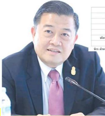
วิณะโรจน์ ทรัพย์ส่งสุข

สศก. : นายวิณะโรจน์ ทรัพย์ส่งสุข เลขาธิการสำนักงานเศรษฐกิจการเกษตร (สศก.) เปิดเผยถึงภาวะเศรษฐกิจการเกษตรในไตรมาส 2 ปี 2561 (เม.ย.-มิ.ย.) พบว่า ขยายตัว 6.2 % เมื่อเทียบกับช่วงเดียวกันของปี 2560 เนื่องจากสภาพอากาศที่เอื้ออำนวยต่อการผลิตทางการเกษตรมีการพัฒนาแหล่งน้ำและระบบการกระจายน้ำอย่างมีประสิทธิภาพประกอบกับการดำเนินนโยบายที่สำคัญ อาทิ การตลาดนำการผลิต การส่งเสริมเกษตรแบบแปลงใหญ่ การพัฒนาคุณภาพสินค้าเกษตรสู่มาตรฐาน ทำให้การผลิตสินค้าเกษตรมีประสิทธิภาพ และมีมาตรฐานที่ดีขึ้น ส่งผลให้ผลผลิตพืชเศรษฐกิจเพิ่มขึ้น โดยสามารถแยกเป็นรายสาขาได้ดังนี้ สาขาพืช ขยายตัว 8.4% เมื่อเทียบกับช่วงเดียวกันของปีที่แล้ว โดยผลผลิตพืชสำคัญที่เพิ่มขึ้นได้แก่ ข้าวนาปี ข้าวนาปรัง ข้าวโพดเลี้ยงสัตว์ อ้อยโรงงาน สับปะรดโรงงาน ยางพารา ปาล์มน้ำมัน ลำไย และเงาะ ด้านราคา สินค้าที่มีราคาเฉลี่ยเพิ่มขึ้น ได้แก่ ข้าว ข้าวโพดเลี้ยงสัตว์ มันสำปะหลังทุเรียน และมังคุด โดยข้าว มีราคาเพิ่มขึ้นแม้ว่าจะมีปริมาณข้าวออกสู่ตลาดเพิ่มขึ้นแต่ความต้องการของตลาดมีแนวโน้มเพิ่มขึ้นเช่นกัน ข้าวโพดเลี้ยงสัตว์ ราคาเพิ่มขึ้นเพราะความต้องการใช้เป็นวัตถุดิบในอุตสาหกรรมอาหารสัตว์เพิ่ม