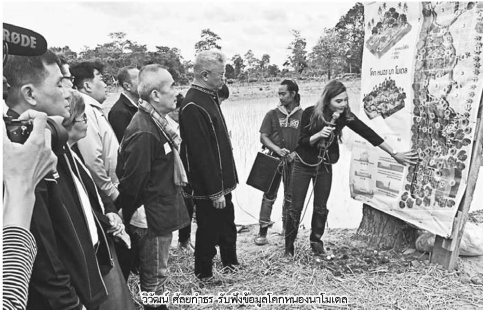
วิวัฒน์ ศัลยกำธร รับฟังข้อมูลโคกหนองนาโมเดล

รมช.เกษตรและสหกรณ์ กล่าวต่อว่า โคกหนองนา โมเดล เป็นแนวคิดและแนวทางที่เหมาะสมกับสภาพชีวิตของคนไทยที่มีอาชีพเกษตรกรรมเป็นรากฐานของสังคม โดยได้น้อมนำพระราชดำรัสในพระบาทสมเด็จพระปรมินทรมหาภูมิพลอดุลยเดช รัชกาลที่ 9 ด้านการทำเกษตรทฤษฎีใหม่ตามแนวเศรษฐกิจพอเพียง มาใช้ในการบริหารจัดการน้ำและพื้นที่การเกษตรผสมผสานกับ ภูมิปัญญาพื้นบ้านได้อย่างสอดคล้อง โดยนำมาปรับเป็นคำพูดที่ง่ายต่อการเข้าใจแล้วนำไปสอน และถ่ายทอดแก่เกษตรกรเพื่อให้สามารถช่วยเหลือตนเองและมีชีวิตความเป็นอยู่ที่ดีขึ้น เมื่อพื้นฐานชีวิตมีความมั่นคงแล้ว ชีวิตคนไทยจึงจะมั่นคงและยั่งยืนตลอดไป