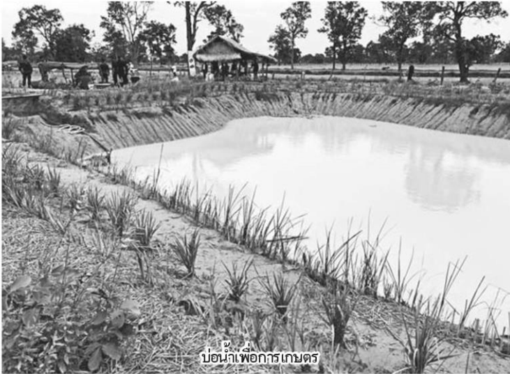
บ่อน้ำเพื่อการเกษตร

หัวข้อข่าว: ประยุทธ์ 'โคกหนองนา' สุราษฎร์ไศลนำ 'ศาสตร์พระราช' พื้นชีวิตชาวบ้านยั่งยืน