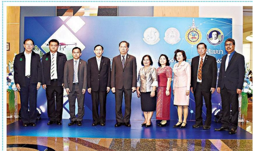
☑ สัมมนา...นายเกษม บุญราช รัฐมนตรีว่าการกระทรวงเกษตรและสหกรณ์ เป็นประธานเปิด การสัมมนาเรื่อง ภาวะเศรษฐกิจการเกษตรปี 2561 และแนวโน้มปี 2562 ในหัวข้อ "โลกเปลี่ยน เกษตรปรับ เกษตรกรปรับเปลี่ยน" ณ โรงแรมมิราเคิล แกรนด์ คอนเวนชั่น กรุงเทพฯ