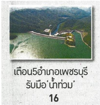
เขื่อน5อำเภอเพชรบุรี รับมือ'น้ำท่วม' 16