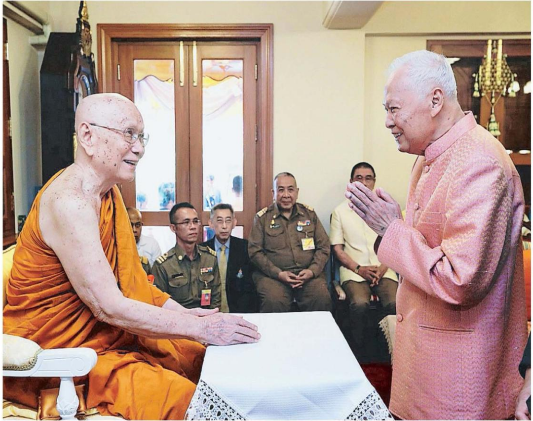
▲98 ปี “ป้า” พล.อ.เปรม ติณสูลานนท์ ประธานองคมนตรีและรัฐบุรุษ กราบสักการะสมเด็จพระอริยวงศาคตญาณ สมเด็จพระสังฆราช ในโอกาสครบรอบวันเกิด 98 ปี ที่วัดราชบพิธสถิตมหาสีมาราม ด้วยสีหน้าสดชื่น ยิ้มแย้มแจ่มใส สุขภาพยังคงดูแข็งแรง แต่ปฏิเสธให้สัมภาษณ์ผู้สื่อข่าวอย่างอารมณ์ดี.