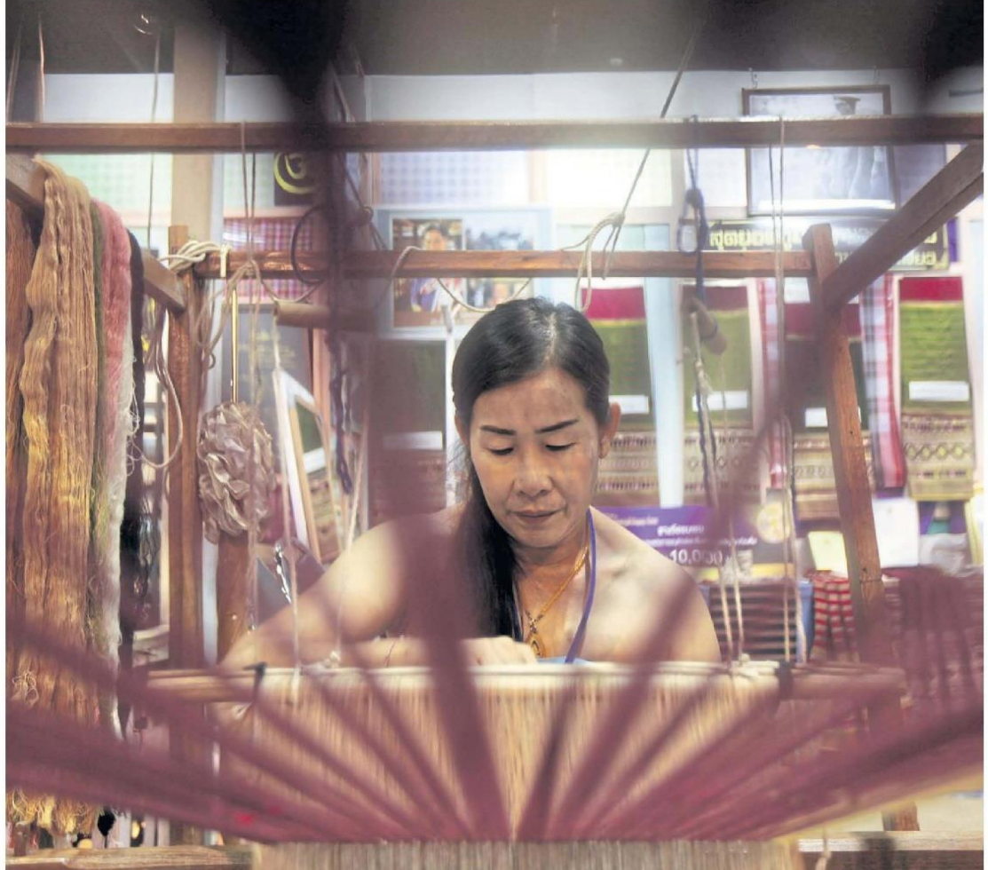
Fabric weaving on display at Otop Silapachep Fair.