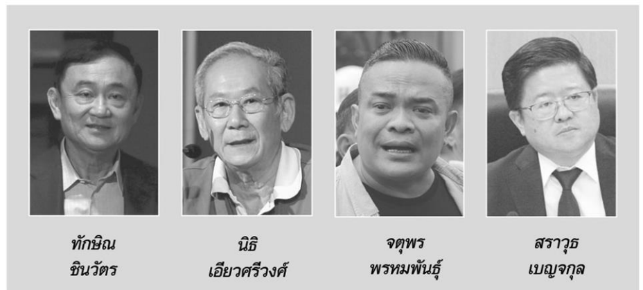
ทักษิณ ชินวัตร

ได้อย่างไร ซึ่ง “นิติ” ที่เป็นกัลยาณมิตรของฝ่ายประชาธิปไตยยังกล้าเตือนอย่างเจ็บๆ ด้วยว่า “พรรคก็ต้องพิสูจน์ตนเองให้เห็นว่าเป็นพรรคการเมืองจริง ไม่ใช่แก๊งสมุนทักษิณ”... ● อีกเสียงอย่าง “จตุพร พรหมพันธุ์” ประธาน นปช. ให้สัมภาษณ์รายการ Thai Voice ของจอม เพชรประดับ ฟากถึงนักการเมืองที่มีความปรารถนาจะมีการเลือกตั้ง อย่าดำเนินการเหมือนปัจจุบันนี้ได้หรือไม่ เอาเรื่องของบ้านเมืองให้เหนือกว่าเรื่องของพรรค เอาเรื่องส่วนตัวให้เป็นรองเรื่องส่วนรวม ฝ่ายการเมืองต้อง