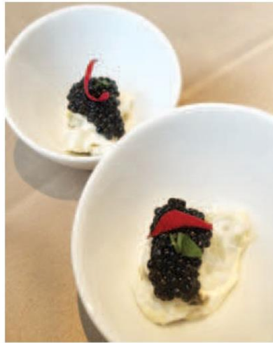
เมนู 'คาเวียร์บนครีมส้มยูซุ' ใช้คาเวียร์ที่ผลิตในประเทศไทย

โดยเฉพาะ โครงการบ้านเล็กในป่าใหญ่ ดอยดำ ซึ่งตั้งอยู่ห้องที่ตำบลเมืองแหง อำเภอเวียงแหง จังหวัดเชียงใหม่ อยู่ในเขตอุทยานแห่งชาติห้วยน้ำดัง คือสถานที่ต้นกำเนิดแห่งความสำเร็จในการผลิต 'คาเวียร์' ได้เป็นครั้งแรกในประเทศไทย "สถานที่ตรงนั้นยังไม่ถึงกับไม่มีต้นไม้ เมื่อเสด็จพระราชดำเนินครั้งแรก (พ.ศ.2545) สมเด็จพระนางเจ้าฯ พระบรมราชินีนาถ ทรงรับสั่งถามชาวบ้านว่า มีน้ำเป็นยังไง ปรากฏว่าน้ำดี-อากาศเย็น แต่ไม่มีปลาตัวเล็กตัวน้อย เพราะอากาศเย็นมาก ปลาชุมลงไปอยู่ในทราย ซึ่งเป็นที่มาที่เราตื่นตาตื่นใจในวันนี้คือสามารถเลี้ยงปลาเทราต์ และต่อมาเลี้ยงปลาสเตอร์เจียน จนเราสามารถผลิตคาเวียร์ได้ในประเทศไทยซึ่งเป็นเมืองร้อน" ท่านผู้หญิงจรงจิตต์ กล่าว และว่า ในเวลานั้นคุณ จรัลธาดา กรรณสูต ดำรงตำแหน่งรองอธิบดีกรมประมง ตามเสด็จพระราชดำเนินด้วย คุณจรัลธาดา กรรณสูต ที่ปรึกษาสำนักพระราชวัง เล่าให้ฟังถึงที่มาของการเลี้ยงปลา สเตอร์เจียน (sturgeon) ในประเทศไทย ซึ่งเป็นปลาที่ให้ผลผลิต 'คาเวียร์' โดยสืบย้อนกลับไปยังจุดกำเนิดของ 'โครงการบ้านเล็กในป่าใหญ่ ดอยดำ' และเป็นการต่อยอดความสำเร็จจากการเลี้ยงปลาเรนโบว์เทราต์ ซึ่งกว่าจะสำเร็จต้องใช้เวลาและได้การเสด็จพระราชดำเนินเยือนต่างประเทศเข้าช่วย