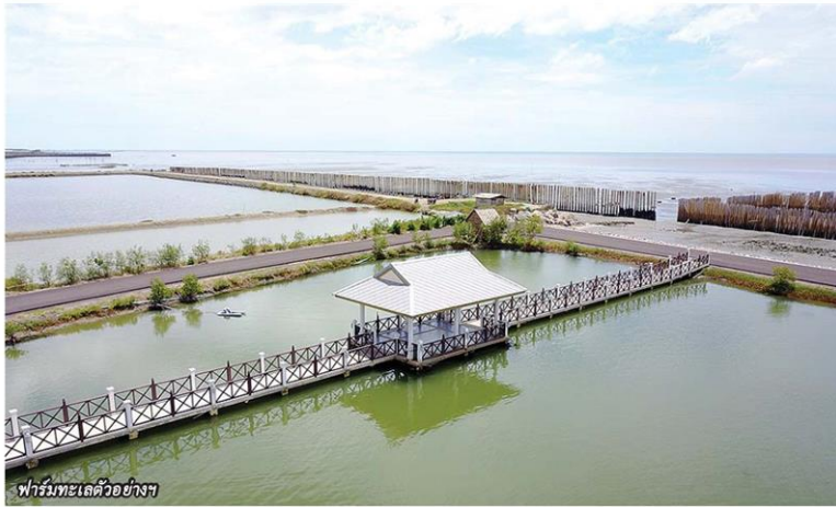
ฟาร์มทะเลตัวอย่าง