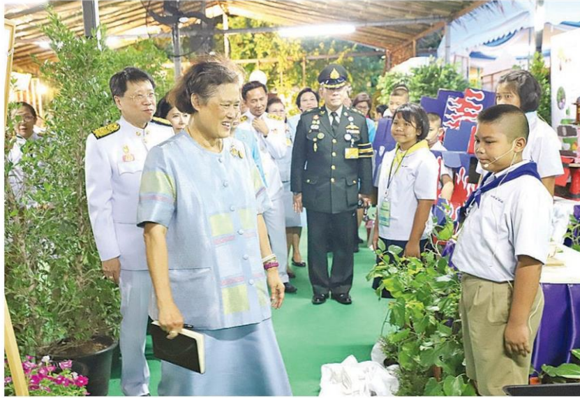
สมเด็จพระเทพรัตนราชสุดาฯ สยามบรมราชกุมารี เสด็จพระราชดำเนินไปทรงเปิดงาน “สีสรรพรรณไม้ เทิดไถ้บรมราชินีนาถ” ครั้งที่ 12 โอกาสนี้ ทอดพระเนตรนิทรรศการที่หน่วยงานต่างๆ นำมาจัดแสดง เฉลิมพระเกียรติสมเด็จพระนางเจ้าสิริกิติ์ พระบรมราชินีนาถ ในรัชกาลที่ 9 ณ สวนสมเด็จพระนางเจ้าสิริกิติ์ จตุจักร กรุงเทพฯ เมื่อวันที่ 9 สิงหาคม