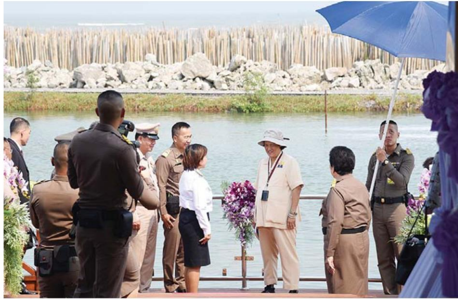
สมเด็จพระเทพรัตนราชสุดาฯ สยามบรมราชกุมารี เสด็จฯ ทอดพระเนตรโครงการฟาร์มทะเลตัวอย่าง เมื่อวันที่ 5 กุมภาพันธ์ 2561