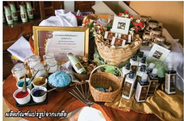
ผลิตภัณฑ์แปรรูปจากเกลือ

โครงการฟาร์มทะเลตัวอย่างตามพระราชดำรินี้ ถือเป็นแหล่งศึกษาแลกเปลี่ยนเรียนรู้ด้านการประมงแก่เกษตรกรทั้งในและต่างพื้นที่ ได้นำไปปรับใช้ในการประกอบอาชีพประมงทางเลือก