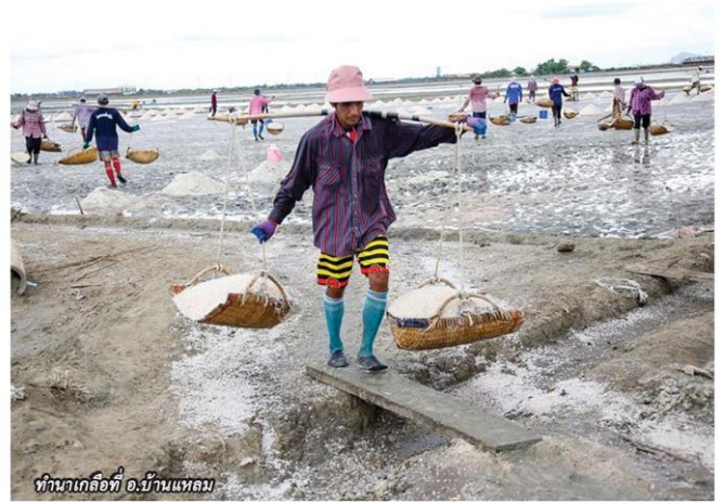
ทำนาเกลือที่ อ.บ้านแหลม

ตัวอย่างปรับเปลี่ยนให้เหมาะสมกับสภาพ พื้นที่ดินของตัวเอง