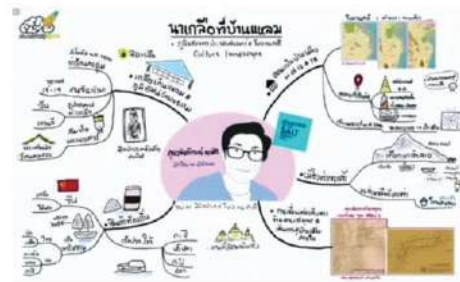
สรุปโดยมายแมป