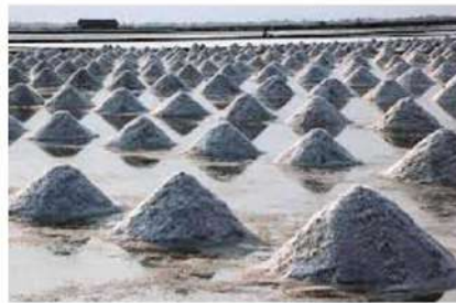
นาเกลือบ้านแหลม