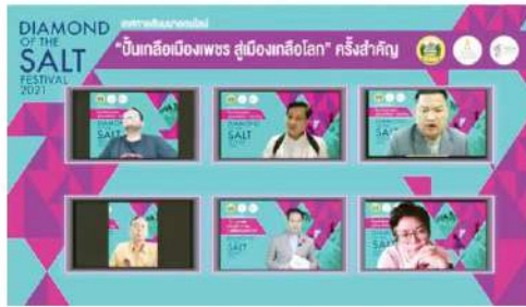
คณะวิทยากร

คอลัมน์: ภูมิบ้าน ภูมิเมือง: 'เพชรบุรี' ภูมิเกลือทะเลไทยสู่เมืองเกลือของโลก