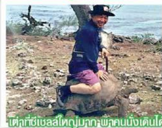
เด็กซีเซลล์ใหญ่บวกรักษาคนนั่งเด็คดี

แพง คนท้องถิ่นก็มีชีวิตอยู่อย่างปกติสุข นักท่องเที่ยวจะเป็นแบบขั้นเล็ก่อนข้างมาก พวกแบกเป้ เงินน้อยไม่ค่อยมีให้เห็น คามาที่ที่ต้องชอบธรรมชาติ ชอบทะเล ชอบดูเรื่องปลา อากาศเย็นสบายลมทะเลพัดตลอด