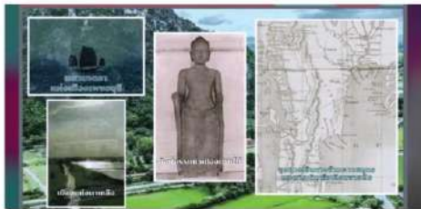
โบราณคดีแหล่งเกลือ