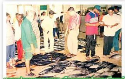
ตลาดปลาทูน่าเกาะบาหลี เมืองหลวงประเทศอินโดนีเซีย

มองคุณภาพชีวิต ชีวิตของคนเขียนข่าวของผมยาวนานมาเกิน 30 ปีแล้ว ถ้ามามีแรงอะไรจิตใจหรือจึงทำให้หลุดล้าหัดตอนด้วยใจรักมายาวนานเช่นนี้ การทำข่าวทำให้มีโอกาสได้พบผู้คนเพิ่มขึ้นแต่ละท่านล้วนเป็นผู้มีพระคุณ นำเรื่องราวมาเล่าให้ฟัง ทั้งเรื่องสุขภาพและอื่นๆ โดยเฉพาะเรื่องการท่องเที่ยว ทำให้เราได้เห็นโลกกว้างขึ้น ทำให้ชีวิตมีการเปลี่ยนแปลง ไม่เบื่อ มีสิ่งใหม่ๆ ให้ได้พบเห็นอยู่เสมอ