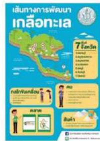
แนวทางพัฒนาเกลือทะเล