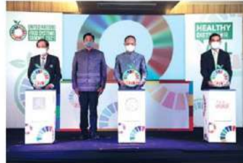
'เกษตรฯ-สสส.-สช.' ร่วมพลิกโฉมประเทศ สร้างระบบอาหารที่ยั่งยืนรับมือวิกฤต