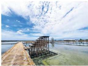
จุดถ่ายภาพนาเกลือ