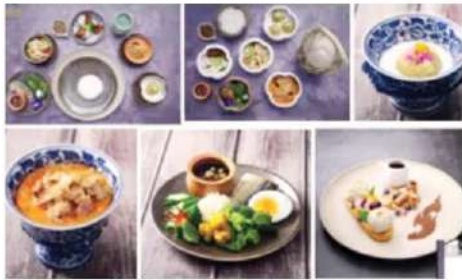
อาหารที่มีเกลือประกอบ