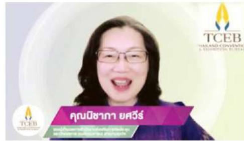
ผู้ประสานการจัดประชุม