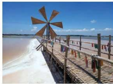
นาเกลือ-สถานท่องเที่ยว