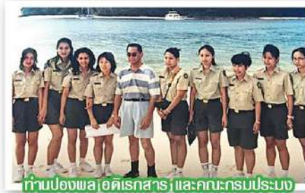
ท่านรองพลอติเรกสาร และคณะกรมประมง

เกาะ ADABRA มีชื่อเสียงทางธรรมชาติระดับโลก คณะได้ขึ้นไปเที่ยวบนเกาะมีเต่าตัวใหญ่มาก สามารถนั่งให้เต่าพาเดินได้เลย ปูมะพร้าวใหญ่มากเช่นกัน เกาะนี้แปลกตอนกลางคืนน้ำท่วมหมด รุ่งเช้าน้ำแห้งหมด ทำให้เกิดธรรมชาติแปลก ๆ น่าสนใจมาก การเดินทางครั้งนี้ทำให้ได้รับความรู้รอบตัวมากมาย ลำพังตัวเองคงไม่มีโอกาสเช่นนี้ คนทำ