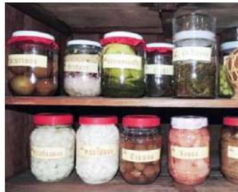
ผลิตภัณฑ์ที่มีเกลือตั้งต้น