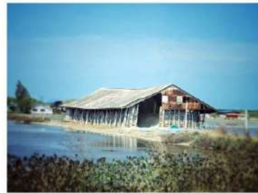
โรงเกลือ

สร้างความยั่งยืนของงานเทศกาล โดยมีเป้าหมายที่ ๑ เมือง ๑ สิทธิบัตรงานเทศกาล เพื่อขับเคลื่อนเมืองสู่ระบบเศรษฐกิจใหม่