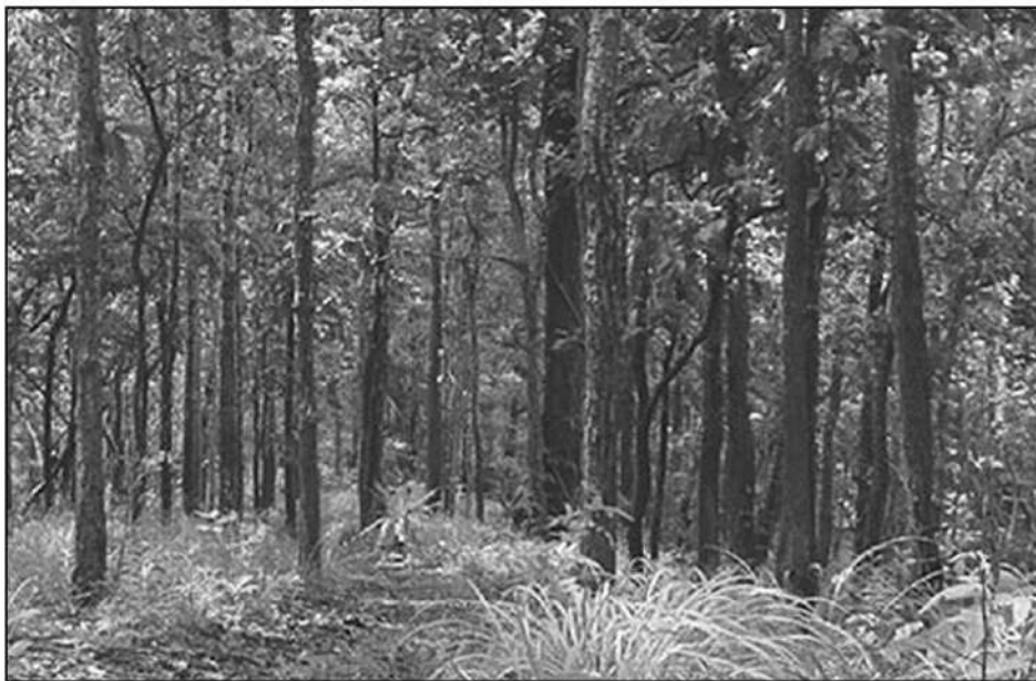
ผลักดันโครงการแลกเปลี่ยนคาร์บอนเครดิตป่าในพื้นที่ป่าสงวนฯ

ดำเนินการไม่น้อยกว่า 10 ปี สนับสนุนแนวทางการลดการปล่อยก๊าซเรือนกระจก โดยสามารถนำคาร์บอนเครดิตที่ได้รับจากการดำเนินโครงการไปขอการรับรองตามกลไก T-VER