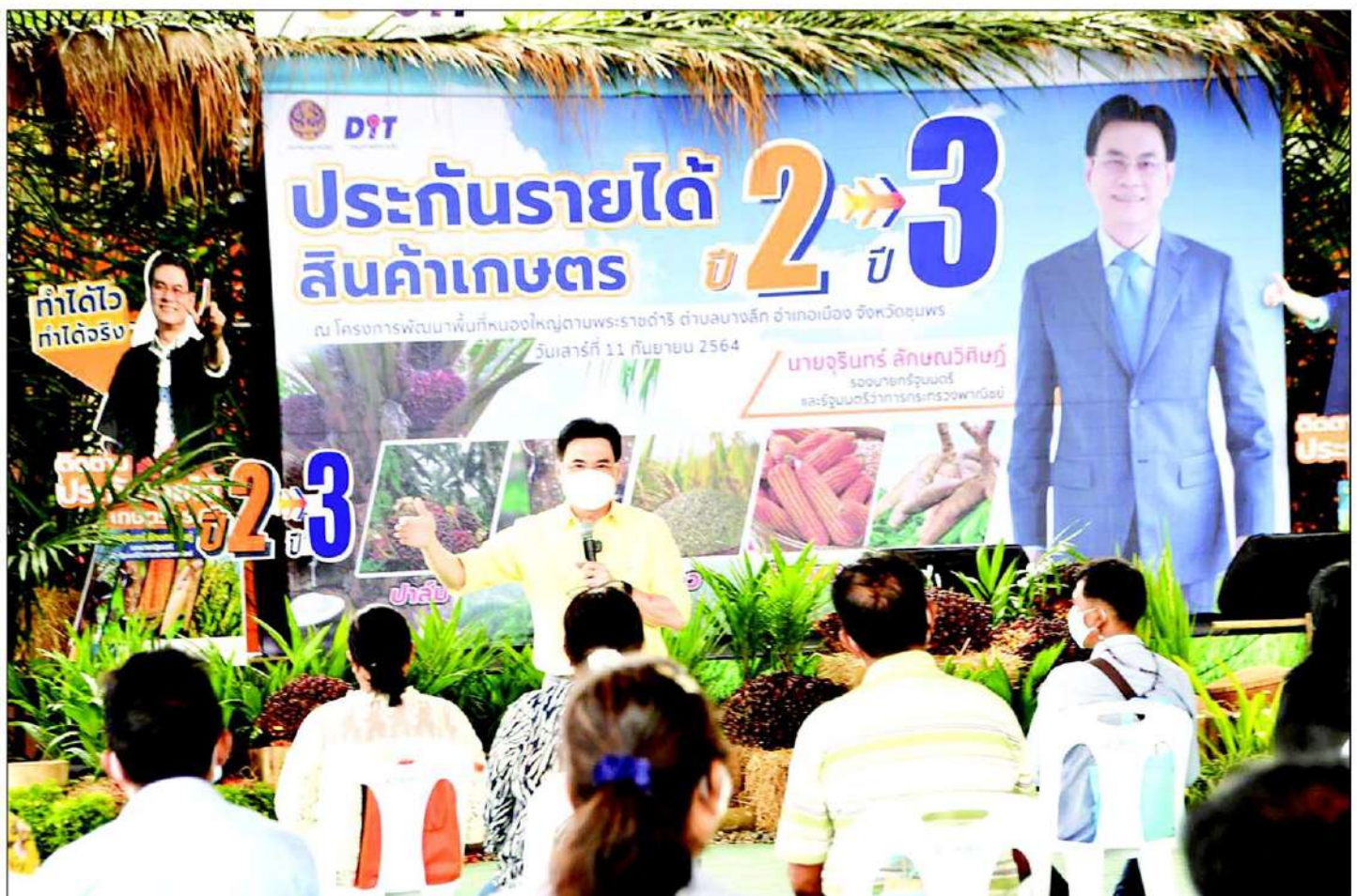
นายจรินทร์ ลักษณวิศิษฏ์ รองนายกรัฐมนตรีและ รมว.พาณิชย์ เป็นประธานในพิธีมอบเช็คชำระหนี้และมอบโฉนดที่ดินของกองทุนฟื้นฟูช่วยเหลือเกษตรกรให้แก่เกษตรกรชาวจังหวัดชุมพร

ยางพารามีปัญหาอยู่ตัวเดียวคือน้ำยางราคาลงเหลือที่โลกรัมละ 40-50 บาทในช่วง ราคาต่ำกว่ารายได้ที่ประกันไว้ ที่โลกรัมละ 57 บาท เพราะน้ำยางส่วนมากนำไปทำ