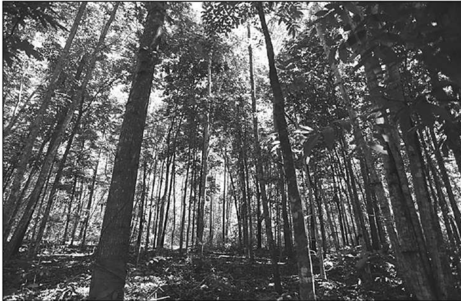
แบ่งปันคาร์บอนเครดิตจากป่าสงวนแห่งชาติ