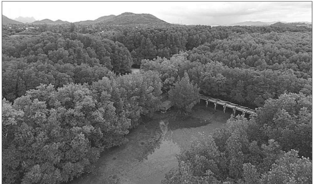
พื้นที่ป่าชายเลนในไทยมีศักยภาพการดูดกลับก๊าซเรือนกระจก

ปัจจุบันจีนปล่อยเป็นอันดับ 1 รองลงมาสหรัฐ และญี่ปุ่น ส่วนไทยอยู่อันดับที่ 20 ปล่อยก๊าซเรือนกระจกวันละ 1 ตัน รวม 365 ตันต่อปี โดยมาจากภาคพลังงาน 70% รองลงมา ภาคเกษตร ตัวสำคัญน่าข่าว ภาคอุตสาหกรรมเป็นปูนซีเมนต์ ถัดมาการตัดไม้ทำลายป่า ทำให้พื้นที่กักเก็บก๊าซหายไป อย่างไรก็ตาม ประเทศไทยโชคดียังมีป่า