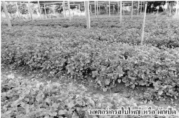
วอเตอร์เครสใบใหญ่ หรือ ผักเปิด

วอเตอร์เครสเป็นพืชที่ปลูกง่าย ชอบน้ำอย่างที่รดน้ำ 3 ครั้ง เช้า เที่ยง เย็น ไม่ค่อย