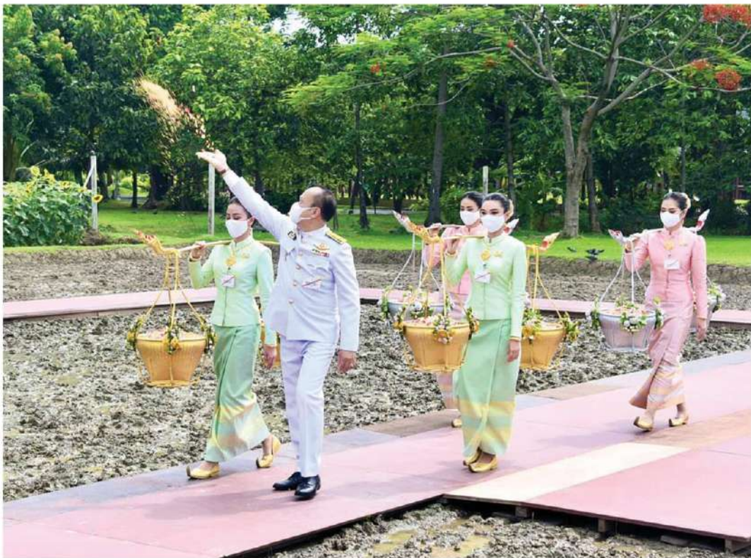
🏠 หว่านข้าว - พระบาทสมเด็จพระเจ้าอยู่หัว ทรงพระกรุณาโปรดเกล้าฯ ให้พล.อ.สุรยุทธ์ จุลานนท์ ประธานองคมนตรี เป็นประธานในพิธีหว่านเมล็ดพันธุ์ข้าวในแปลงนาสาธิต และให้นายทองเปลว กองจันทร์ ปลัดกระทรวงเกษตรและสหกรณ์ เป็นผู้หว่านเมล็ดพันธุ์ข้าว ณ แปลงนาสาธิต สวนจิตรลดา พระราชวังดุสิต เมื่อวันที่ 10 พ.ค.