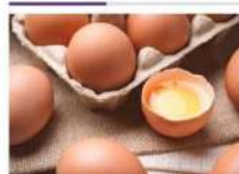
ไข่ราคาขยับ เกษตรกรยังไม่ฟื้นทุกข ชนผู้บริโภคกินไข่ช่วยเกษตรกร