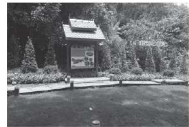
เส้นทางการเรียนรู้ธนาคารอาหารชุมชน ประกอบด้วย 6 ฐานการเรียนรู้

“จากการดำเนินงานจนถึงวันนี้ ธนาคารอาหารชุมชน “เกษตรวิชญา” ได้ทำหน้าที่ตามวัตถุประสงค์ในการเป็นศูนย์บริการ และถ่ายทอดเทคโนโลยีชุมชนในลักษณะห้องเรียนธรรมชาติ ที่รวบรวมพันธุ์ไม้และพืชสมุนไพรที่มีความหลากหลายผ่านฐาน