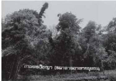
ดินความอุดมสมบูรณ์สู่ป่าในพื้นที่โครงการ

นับตั้งแต่ปี พ.ศ. 2546 เป็นต้นมา สำนักงานการปฏิรูปที่ดินเพื่อเกษตรกรรม หรือ ส.ป.ก. ได้เข้าไปดำเนินการพัฒนาพื้นที่ 123 ไร่ ที่ได้รับมอบจากกระทรวงเกษตรและสหกรณ์ ดำเนินงานโครงการธนาคารอาหารชุมชน ตามวัตถุประสงค์ของโครงการเกษตรวิชญา ซึ่งเป็นโครงการอันเนื่องมาจากพระราชดำริในพระบาทสมเด็จพระปรเมนทรมหาอานันทมหิดลราชกุมาร พระวชิรเกล้าเจ้าอยู่หัว เมื่อครั้งทรงดำรงพระอิสริยยศสมเด็จพระบรมโอรสาธิราชฯ