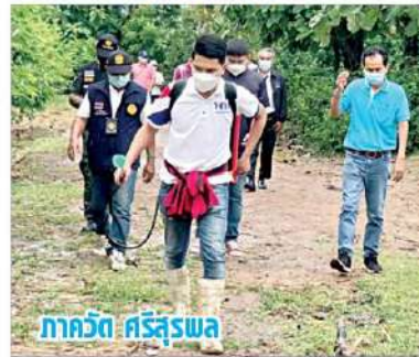
ภาควิฑ ศรีสุรพล