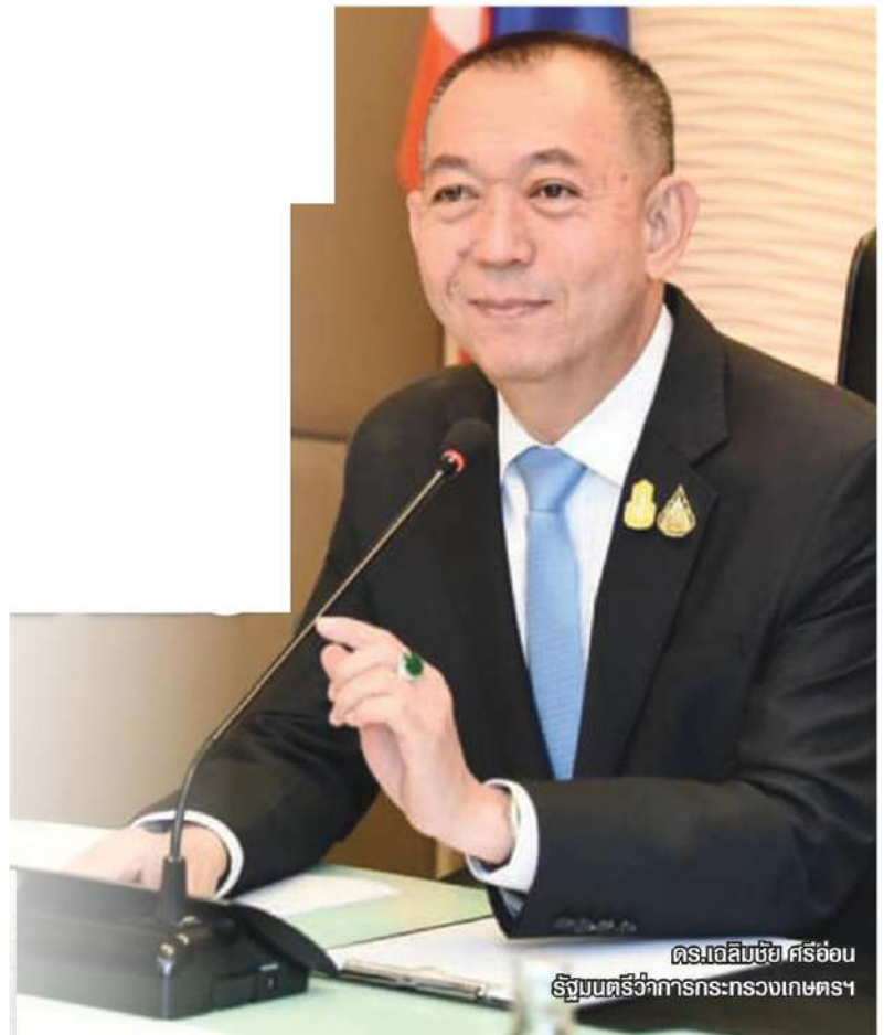
ดร.เฉลิมชัย ศรีอ่อน รัฐมนตรีว่าการกระทรวงเกษตรฯ

5.เกษตรกรรมยั่งยืนตามแนวทางศาสตร์พระราชา โดยมีแนวทางนโยบาย 14 ด้าน ดังนี้