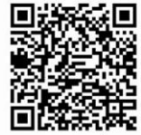
ชมคลิปวิดีโอ