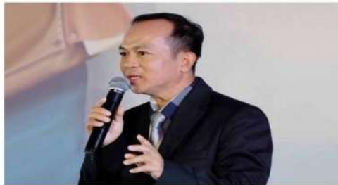
โลจิสติกส์ภาคการสัตวแพทย์ชี้ การป้องกันในช่วงเดือนหน้าจะเข้มข้นมากขึ้น การป้องกันโรค ASF และโควิด-19 และยังมีการดูแลจากโรคในฤดู