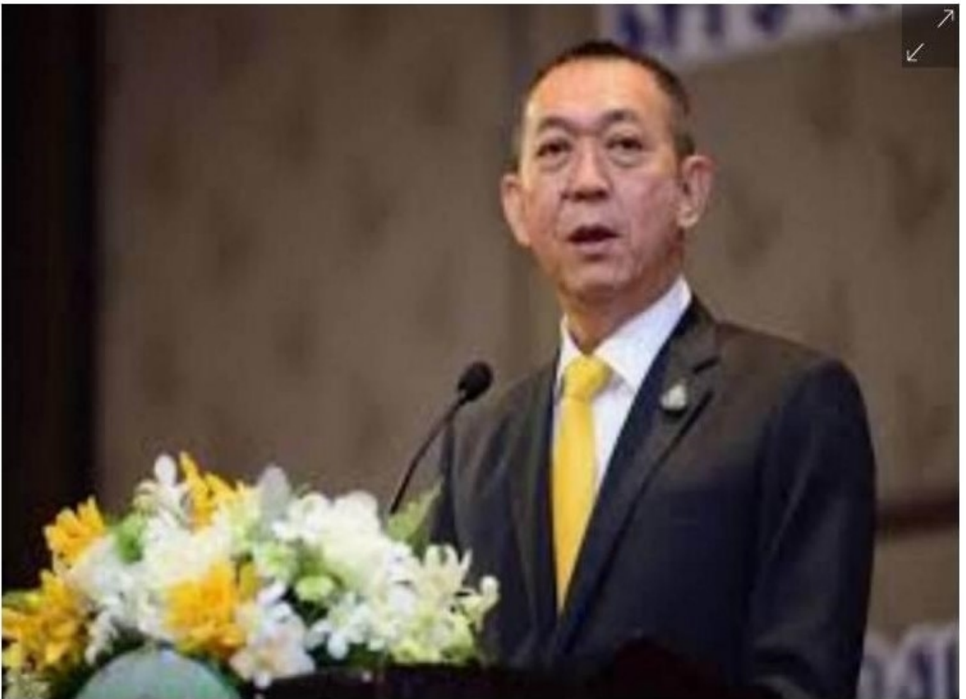
ดร.เฉลิมชัย ศรีอ่อน รัฐมนตรีว่าการกระทรวงเกษตรและสหกรณ์

นายอลงกรณ์ พลบุตร ที่ปรึกษารัฐมนตรีว่าการกระทรวงเกษตรและสหกรณ์ เปิดเผยกับสื่อมวลชนวันนี้ ( 31 ธันวาคม 2563 )ถึงผลงานของกระทรวงเกษตรและสหกรณ์ปี 2563 ว่า ปี2563 เป็นปีที่ประเทศไทยต้องเผชิญกับความยากลำบากทางเศรษฐกิจและสังคมอย่างรุนแรงจากผลกระทบของโควิด19 ทำให้การเติบโตขยายตัวของจีดีพี และการส่งออกติดลบ คนว่างงานสถานประกอบการหยุดกิจการจำนวนมาก เป็นความยากลำบากที่รุนแรงมากที่สุดครั้งหนึ่ง