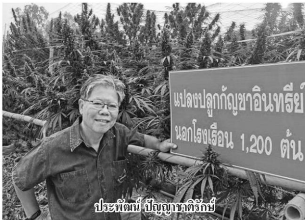
ประพัฒน์ ปัญญาชาติรักษ์

เริ่มกันที่นายประพัฒน์ ปัญญาชาติรักษ์ ประธานสภาเกษตรกรแห่งชาติ ฉายภาพให้เห็นว่าในปี 2564 เกษตรกรไทยต้องเจอปัญหาอุปสรรคหลายอย่าง ประเด็นแรกต้องเจอกับวิกฤตการแพร่ระบาดของโรคโควิด-19 ที่ยังไม่จบง่ายๆ ส่งผลให้ระบบโลจิสติกส์และห้างโมเดิร์นเทรดยังไม่สามารถเปิดได้เต็มรูปแบบเหมือนเมื่อก่อน ทำให้จำนวนลูกค้าไม่มากเหมือนเดิมจนกว่าคนส่วนใหญ่จะได้รับวัคซีน ดังนั้นในปี 2564 เกษตรกรยังต้องเจอเรื่องนี้อยู่