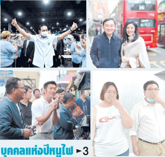
บุคคลแห่งปีหนูไฟ > 3