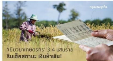
'เยียวยาเกษตรกร' ตรวจสอบสิทธิ์ 'ธ.ก.ส.' 5 พัน 3.4 แสนรายรีบเช็คสถานะเงินห้าพัน