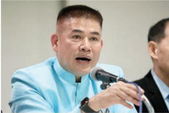
ร.อ.ธรรมนัส พรหมเผ่า