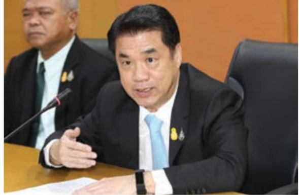
สุริยะ จึงรุ่งเรืองกิจ