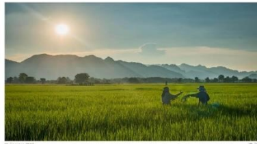
กระทรวงเกษตรฯ ตรวจสอบเกษตรกรในเขตขอนแก่น เร่งยื่น คัดกรอง หลังข้าราชการอุทธรณ์เงินเยียวยา 11 พันรายว่ามีใบทะเบียนเกษตรกรผิดปกติ