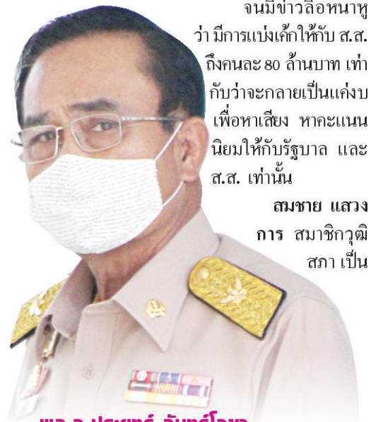
พล.อ.ประยุทธ์ จันทร์โอชา

กลับเร่งให้แต่ละกระทรวงต้องเสนอโครงการเข้ามา นั้น ต่อให้คิดอีกทีรอบ มันก็ย่อมคลงแคลงใจ