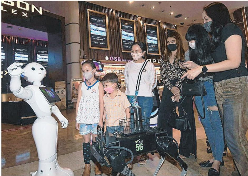
▲ สุดล้ำ ทั้งเด็กทั้งผู้ใหญ่ให้ความสนใจกับหุ่นยนต์อัจฉริยะของเอไอเอสที่โรงพยาบาลรามาธิบดี ชินีพลีทซ์ นำมาใช้ตามมาตรการรับมือโควิด ทั้งวัดอุณหภูมิ ต้อนรับและแสดงตัวอย่างภาพยนตร์ที่กำลังเข้าฉายสร้างสีสันให้ผู้เข้ามาใช้บริการ.