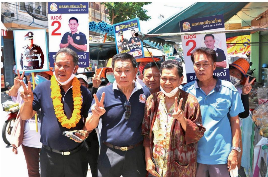
ช่วยเหลือเสียง - พล.ต.อ.เสรีพิศุทธ์ เตมียาเวส หัวหน้าพรรคเสรีรวมไทย พร้อมคณะลงพื้นที่ช่วย ร.ต.ท.สมบุญรณ์ กล้าผจญ ผู้สมัครรับเลือกตั้ง ส.ส. ลำปาง เขต 4 พรรคเสรีรวมไทย หาเสียงย่านร้านค้า ตลาดสด อ.เถิน จ.ลำปาง เมื่อวันที่ 1 มิถุนายน

เมื่อถามว่า จะมีผลต่อการปรับคณะรัฐมนตรี (ครม.) หรือไม่ นายไพบูลย์กล่าวว่า คิดว่า กก.บห. พรรคที่ลาออกประสงค์ให้เป็นไปตามข้อบังคับ เป็นเรื่องภายในพรรค พปชร. การดำเนินการของพรรคการเมืองก็มีการเปลี่ยนแปลงอย่างนี้เป็นประจำอยู่แล้วแต่พรรค พปชร. ต่างหากที่ไม่ค่อยมีการเปลี่ยนแปลงในลักษณะนี้ เพราะเป็นพรรคการเมืองใหม่ ส.ส. มาจากหลายๆ กลุ่ม มีความจำเป็นต้องปรับตัวเพื่อให้พรรคได้ตอบสนองความต้องการของ ส.ส. ที่เข้ามา โดยการเปลี่ยน