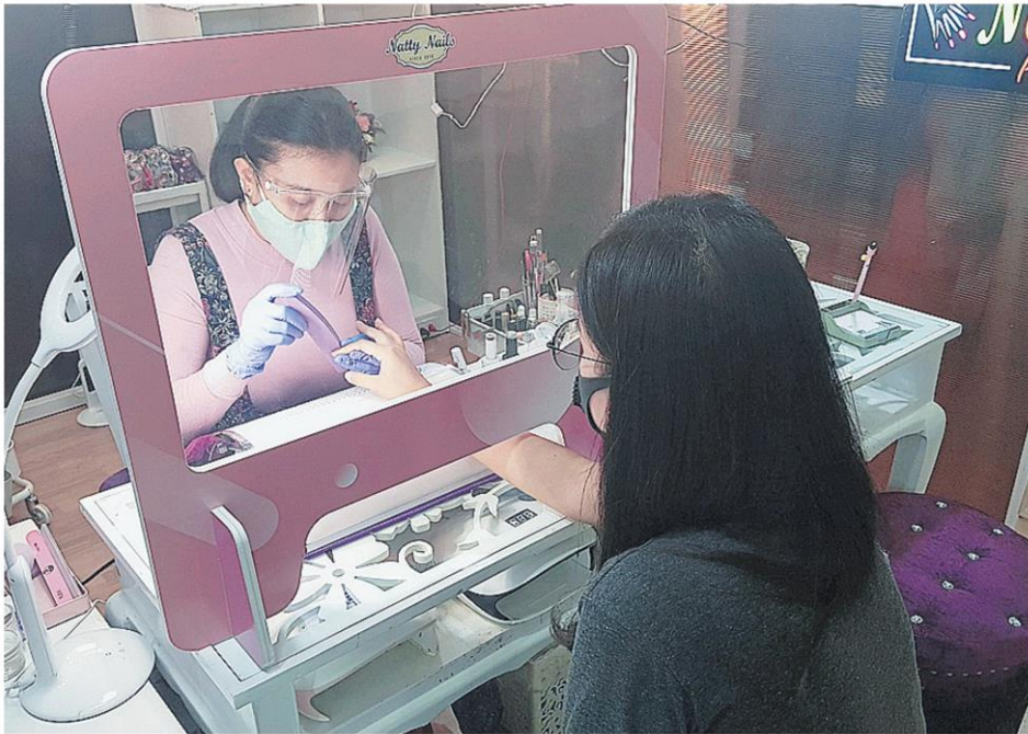
นิตนอร์มอล ร้าน natty nails รับ ตกแต่งเสริมความงาม เล็บชั้น G ศูนย์ราชการ แจ้งวัฒนะ ทำฉากพลาสติก ใสกันระหว่างช่าง ทำเล็บกับลูกค้าเพื่อความ ปลอดภัย แต่เปิดช่อง เล็กๆด้านล่างให้ลูกค้า สอดมือเข้ามาให้ตกแต่ง เสริมความงามเล็บ.