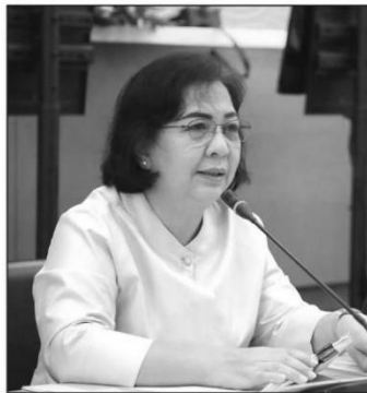
ทัศนีย์ เมืองแก้ว

ปัญหาข้างต้นส่งผลให้บางประเทศประกาศใช้มาตรการทางการค้าที่อาจขัดแย้งกับกฎระเบียบของ WTO เช่น การห้ามส่งออกสินค้าเกษตรและอาหาร รวมถึงผลิตภัณฑ์ที่ใช้ป้องกันรักษาโรค COVID-19 เพื่อบรรเทาภาวะความขาดแคลนสินค้าในประเทศของตน จึงจำเป็นต้องกำชับให้ประเทศสมาชิก WTO ร่วมกันหาแนวทางใช้มาตรการต่างๆ เพื่อไม่ก่อให้เกิดเป็นอุปสรรคทางการค้าของโลกโดยไม่จำเป็น เพราะการใช้มาตรการเช่นนี้ อาจทำให้ห่วงโซ่อุปทานสินค้าอาหารของโลกลดต่ำลง ราคาสินค้าสูงขึ้น