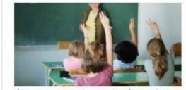
สิงคโปร์. มาษาชาติขำถนบเมืองอ่าวคราวถึง 8 มี.ค.