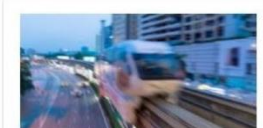
รพม.กำหนดขายของประมูลรถไฟฟ้ามหานคร 1 พ.ค.นี้