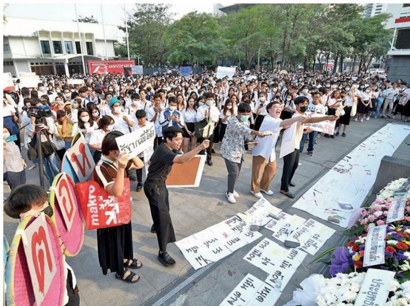
รวมตัว - นักศึกษา มศว ประสานมิตร รวมตัวทำกิจกรรม “#มศวขอมีจุดยืน” ที่บริเวณเสาธง ภายใน มศว ประสานมิตร เมื่อวันที่ 26 กุมภาพันธ์

จากนั้นนายศุภชัย ใจสมุทร ส.ส.บัญชีรายชื่อ พรรคภูมิใจไทย (ภท.) ลุกขึ้นประท้วงว่า “นายวิโรจน์ใส่ร้ายป้ายสี และกล่าวหา” จนเกิดการประท้วงอยู่สักพักก่อนเหตุการณ์จะปกติ นอกจากนี้ในระหว่างที่นายวิโรจน์ลุกขึ้นอภิปรายไม่ไว้วางใจ พล.อ.ประยุทธ์ เปิดประเด็นว่า กอ.รมน. เป็นหน่วยงานขึ้นตรงของนายกาได้ใช้เงินภาษีประชาชน โดยยกเอกสาร