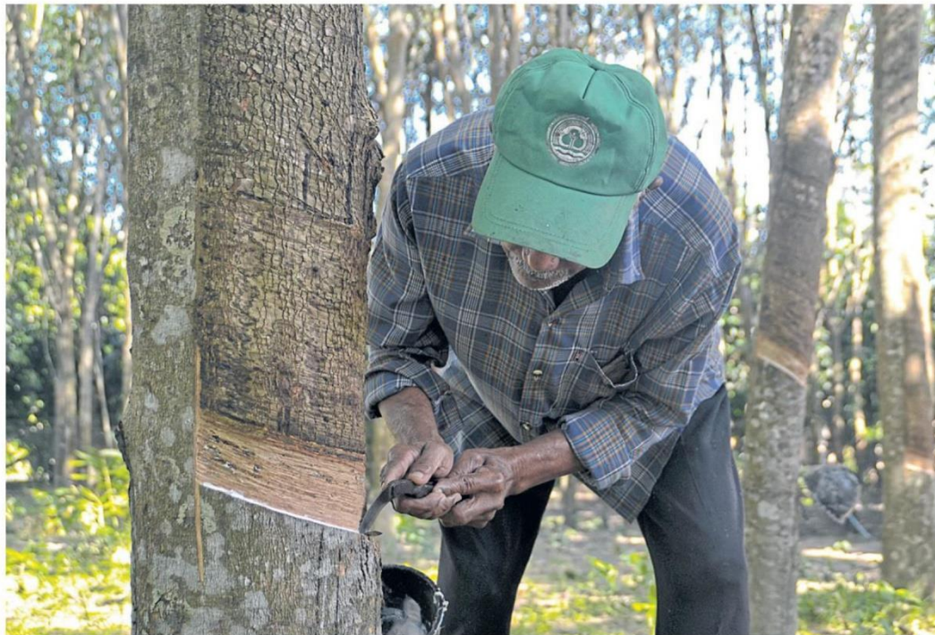
A local farmer taps a rubber tree in Phuket. China's closure of factories is denting the industry.

The Thai rubberwood industry is among the hardest hit by the impact of the ongoing coronavirus epidemic. B2