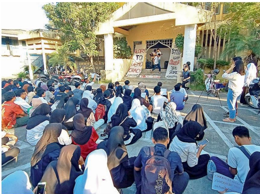
แสดงจุดยืน - นักศึกษามหาวิทยาลัยสงขลานครินทร์ วิทยาเขตปัตตานี จัดกิจกรรม “แฟลชม็อบจากรุสมีแล ไม่แคร์เผด็จการ” แสดงจุดยืนประชาธิปไตยที่ จ.ปัตตานี เมื่อวันที่ 26 กุมภาพันธ์

จากนั้น นายวิสาร เตชะธีราวัฒน์ ส.ส. เชียงราย พรรคเพื่อไทย (พท.) อภิปรายไม่ไว้วางใจเกี่ยวกับโครงการจัดซื้อเครื่องไปโอเมตริกซ์ การตรวจลายนิ้วมือและภาพถ่ายใบหน้า มีความผิดปกติตั้งแต่สัญญาที่โออาร์ครั้งแรกที่ตั้งงบไว้เพิ่ม 1,735 ล้านบาท แต่ได้ยกเลิกไป และออกสัญญาที่โออาร์ครั้งที่สอง โดยตั้งงบเพิ่มไว้ 2,126 ล้านบาท และให้เหตุผลว่าที่ยกเลิกครั้งแรก เนื่องจากไม่มีผู้รับเหมา อีกทั้งกำหนดว่าไม่ต้องมีการค้ำประกันและไม่ต้องมีผลงานมาก่อน ซึ่งเรื่องนี้ถ้าไม่มีผู้ใหญ่สั่งการ ทำไม่ได้ อีกทั้งยังมีการต่อรองขยายเวลาส่งมอบงานให้บริษัทในครั้งที่ 4 ถึงครั้งที่ 6 อีกด้วย ล่าสุด เมื่อวันที่ 2 กุมภาพันธ์ 2562 สำนักงานตำรวจแห่งชาติ (สตช.) ให้แก้ไขสัญญาและเปลี่ยนแปลงสินค้าหลายรายการสาระสำคัญคือนอกจากไม่ยกเลิกแล้วยังให้แก้ไขสัญญาในสาระสำคัญ มีการเปลี่ยนยี่ห้อจากของเยอรมันเป็นของอีกบริษัทหนึ่ง ซึ่งจากการตรวจสอบราคาหน้าเว็บไซต์สามารถซื้อได้ 113 ล้านบาท แต่กลับมีการตั้งราคาลูกถึง