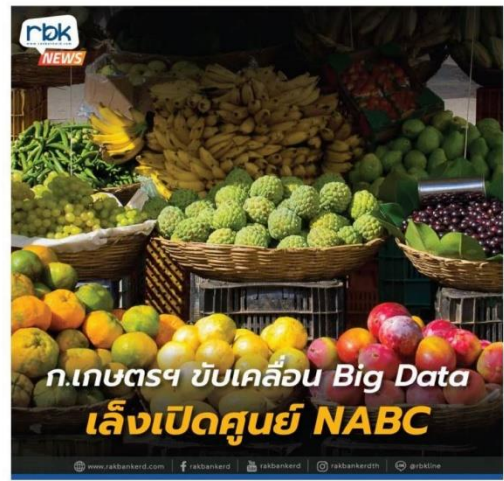
สศก. เป็นหน่วยงานที่ดำเนินงานพัฒนาระบบข้อมูลด้านเศรษฐกิจการเกษตร ที่จัดทำขนาด 40 ปี และขณะนี้ สศก. ได้เตรียมการจัดตั้งศูนย์ข้อมูลเกษตรแห่งชาติ (National Agricultural Big Data Center) หรือ NABC ซึ่งมีความสัมพันธ์กับทุกฝ่าย

ขณะที่ รัฐมนตรีช่วยว่าการสำนักงานเศรษฐกิจการเกษตร (สศก.) นายวราวุธ ศิลปอาชา ได้มอบหมายให้ผู้อำนวยการสำนักงานเศรษฐกิจการเกษตรไปจัดซื้อ จัดหา และดูแลระบบการขับเคลื่อน Big Data and Gov Tech 200 กระทรวงเกษตรฯ โดยมีเลขาธิการสำนักงานเศรษฐกิจการเกษตร (สศก.) เป็นประธาน ร่วมกับหน่วยงานภาครัฐและภาคเอกชนที่เกี่ยวข้องในการขับเคลื่อนการจัดทำ Big Data ด้านการเกษตรให้เกิดผลเป็นรูปธรรม