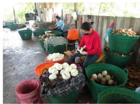
สมาคมมะพร้าวไทยฯ พบว่า ผลผลิตมะพร้าวแคงติดตัว 26 บาท/ผล โดยผู้ส่งออกประมาณ 40% คาดปีนี้ราคาขายดิบขายสุก น่าพอใจขึ้น 10-15% เมื่อเทียบกับปีก่อน