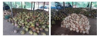
"สมาคมการค้าเกษตรกรชาวสวนมะพร้าว พบว่าผู้ส่งออกมะพร้าวแคงติดตัว โดยจากผลการขายที่ลดลงถึง 40% ทำให้ผลผลิตมะพร้าวแคงติดตัวเพิ่มขึ้น 10-15% เมื่อเทียบกับปีก่อน" รองเลขาธิการ สศก. กล่าว

ทั้งนี้ สำหรับภาพรวมผลผลิตมะพร้าวปี 2564 คาดว่าจะมีปริมาณใกล้เคียงกับปี 2563 อย่างไรก็ตาม ในช่วงเดือนธันวาคมนี้ หากมะพร้าวไทยที่ได้ออกมาขายยังชีพชีพพอ ก็จะเริ่มทำให้ผลผลิตมะพร้าวในภาพรวมของปี 2564 เพิ่มขึ้นได้ โดยในปี 2564 ผลผลิตมะพร้าวของภาคใต้เคยมีปริมาณ และจะออกสู่ตลาดมากขึ้นในสิ้นปีนี้เช่นกัน ซึ่งปีเดียวกันของปี 2564 คาดว่า ราคาจะเฉลี่ยอยู่ใกล้เคียงกับปี 2563 อย่างไรก็ตาม ในช่วงฤดูแล้ง สภาพตลาดแห้งจะกระทบต่อราคาของผลผลิตมากขึ้นในมะพร้าว