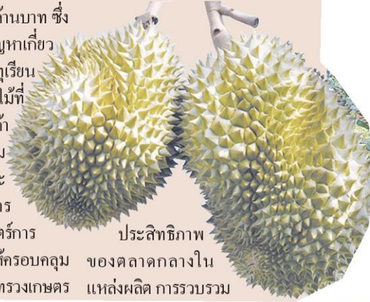
ประสิทธิภาพของตลาดกลางในแหล่งผลิต การรวบรวม

ถ่ายทอดองค์ความรู้และเทคโนโลยีการพัฒนาคุณภาพผลไม้ทั้งในและนอกฤดู 2. พัฒนาขีดความสามารถในการแข่งขันด้านการตลาดไม้ผลด้วยเทคโนโลยีและนวัตกรรม ได้แก่ 1. พัฒนาการตลาดไม้ผลในประเทศ เช่น เพิ่ม