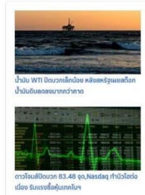
บ้าน WTI ผนวกกับพลัง คลังธรรมชาติ ปังอันล้นหลามกว่าคาด ดาวโจนส์ปิดบวก 83.46 จุด,Nasdaq ทำนิวไฮต่อเมื่อ 3วันเชื่อกันมากขึ้น