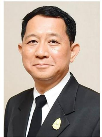
สิริฤกษ์ ทรงศิวิไล