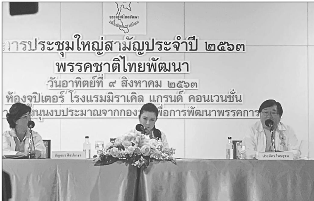
พรรคชาติไทยพัฒนา จัดการประชุมใหญ่สามัญประจำปี 2563 โดยมี น.ส.กัญจนา ศิลปอาชา หัวหน้าพรรค ทำหน้าที่ประธานในที่ประชุมท่ามกลาง ส.ส., กรรมการบริหารพรรค และสมาชิกพรรคจากทั่วประเทศเข้าร่วมพูดคุยอย่างคึกคัก

อุทยานแห่งชาติที่ต่างๆ เพื่อรับฟังปัญหาที่แท้จริง เราได้ผลักดันการยกเลิกการใช้ถุงพลาสติก สามารถลดการใช้ถุงพลาสติกและขยะจากพลาสติกได้กว่า 2 แสนตัน จากประเทศที่อยู่ลำดับ 6 ในการทิ้งถุงพลาสติกลงทะเล ก็ลดลงมาอยู่ที่อันดับ 10 นอกจากนี้เรายังมีโครงการพัฒนาป่าต้นน้ำ โดยประสานงานกับทุกกระทรวง ทั้งกระทรวงเกษตรฯ และกระทรวงมหาดไทยปลูกป่าทั่วประเทศ เรามีเป้าหมายที่จะปลูกป่าและปลูกต้นไม้ให้ได้มากที่สุด ปีหน้าเราต้องปลูกให้ได้ 100 ล้านต้น โดยใช้พื้นที่ป่าชุมชนก่อนเพื่อให้ทุกคนได้มีโอกาสเข้ามามีส่วนร่วมด้วย