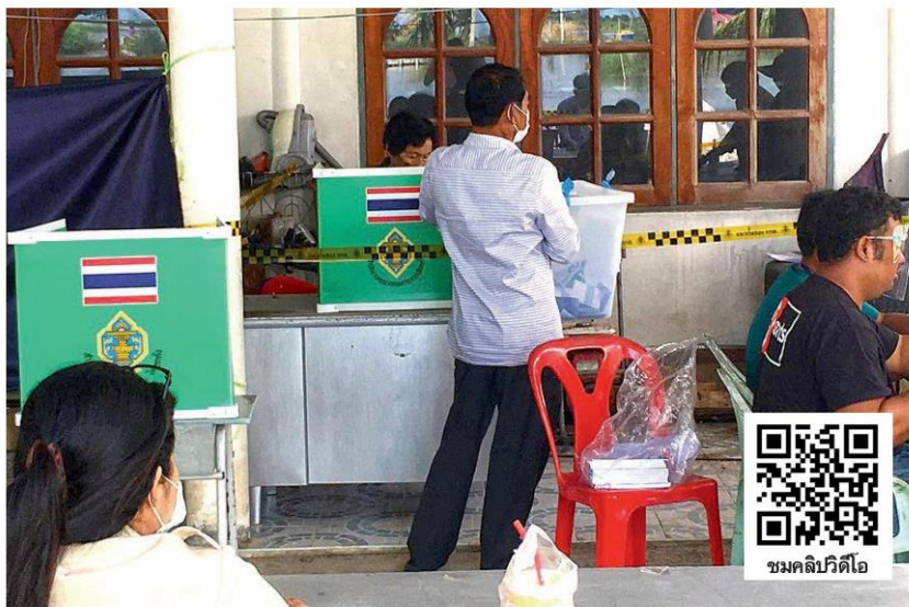
ยกทีมบัตร - ภาพเหตุการณ์ที่ทีมงานพรรคก้าวไกลถ่ายไว้ได้ขณะเจ้าหน้าที่ประจำหน่วยเลือกตั้งยกทีมบัตรลงคะแนนไปให้ประชาชนที่มาลงคะแนนถึงจุดกับัตร พร้อมทั้งระบุพบพิรุอีกหลายหน่วยเลือกตั้งในการเลือกตั้งซ่อม เขต 5 จ.สมุทรปราการ เมื่อวันที่ 9 สิงหาคม

ที่โรงแรมมิราเคิล แกรนด์ คอนเวนชัน หลักสี่ นายวราวุธ ศิลปอาชา รัฐมนตรีว่าการกระทรวงทรัพยากรธรรมชาติและสิ่งแวดล้อม ให้สัมภาษณ์ถึงกระแสข่าวว่า นายศักดิ์ดา วิเชียรศิลป์ อธิบดีกรมทรัพยากรน้ำบาดาล ถูกเรียกปรับเงิน 5 ล้าน เพื่อแลกกับการอนุมัติงบประมาณ ว่า ขณะนี้ตรงกับวันหยุดเสาร์-อาทิตย์ จึงยังไม่สามารถติดต่อกับอธิบดี