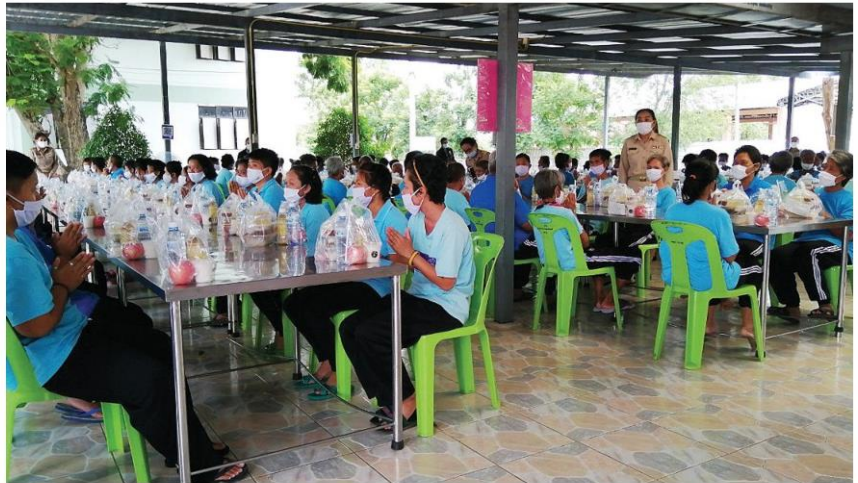
△น้ำพระทัย - พระบาทสมเด็จพระเจ้าอยู่หัว และสมเด็จพระนางเจ้าฯ พระบรมราชินี ทรงพระกรุณาโปรดเกล้าฯ ให้เชิญอาหารพระราชทาน สิ่งของ เครื่องอุปโภคบริโภค และเวชภัณฑ์ไปพระราชทานเลี้ยงและมอบแก่บุคคลไร้ที่พึ่ง ที่สถานคุ้มครองคนไร้ที่พึ่งหญิงธัญบุรี จ.ปทุมธานี วันที่ 10 ส.ค.

เทิดพระเกียรติ พระชนมพรรษา วันที่ 12 สิงหาคม ทักษาทรทำบุญ จุดเทียนทั่วไทย 'ทรงพระเจริญ' รัฐบาลเชิญชวนร่วม จัดกิจกรรม เฉลิมพระ เกียรติสมเด็จพระนาง เจ้าสิริกิติ์ พระบรม ราชินีนาถ □อ่านต่อหน้า 7