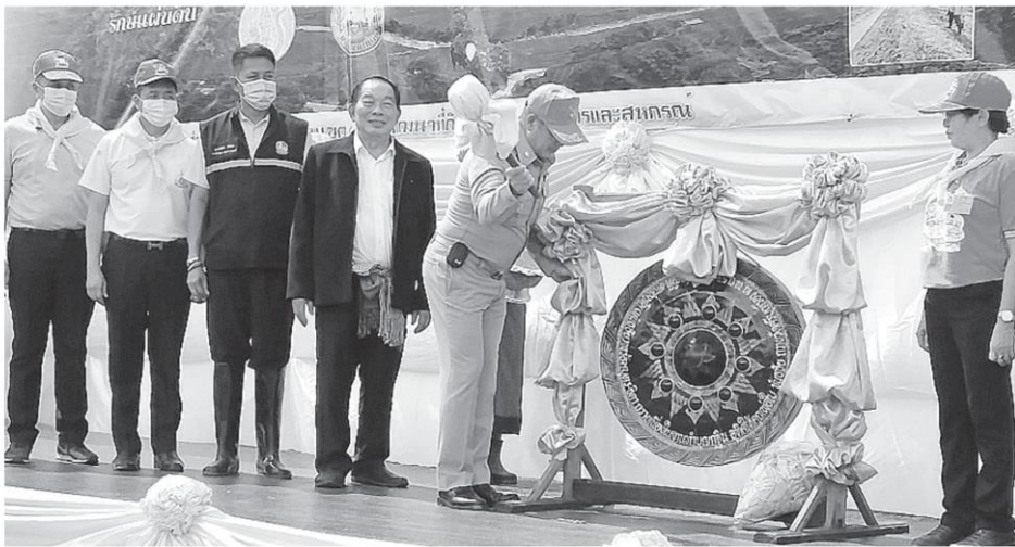
เปิด โครงการ ร.อ.ธรรมนัส พรหมเผ่า รมช.เกษตรและสหกรณ์ ประธานเปิดโครงการ ปลูกไม้ยืนต้น เพื่อการอนุรักษ์ดินและน้ำ เฉลิมพระเกียรติ พระบาทสมเด็จพระเจ้าอยู่หัว เนื่องในโอกาส วันเฉลิมพระชนมพรรษาครบ 68 พรรษา ที่บ้านโนนสร้างคำ หมู่ 13 ต.สุข อ.เพ็ญ จ.อุดรธานี.

ระหว่างหน่วยงานต่างๆในกระทรวงเกษตรฯ บริหารจัดการเชิงรุก (Agri-Map) ดำเนิน งานและ วิเคราะห์พื้นที่ โดยให้เกษตรกรปรับ เปลี่ยนการ ผลิตในพื้นที่ที่ไม่เหมาะสม (N) และพื้นที่ที่มีความเหมาะสมเล็กน้อย (S3) ให้สอดคล้องและมีความเหมาะสมกับ ความต้องการของตลาดมากขึ้น ทำให้เกษตรกรมี รายได้ตลอดปีและมีแหล่งน้ำเพียงพอสำหรับ การปลูกพืชและการเกษตรกรรมมากขึ้น ขณะที่ ร.อ.ธรรมนัส พรหมเผ่า รมช. เกษตรและสหกรณ์ ได้มอบเอกสารสิทธิที่ดิน ทำกินให้แก่เกษตรกรในพื้นที่จำนวน 85 ราย.