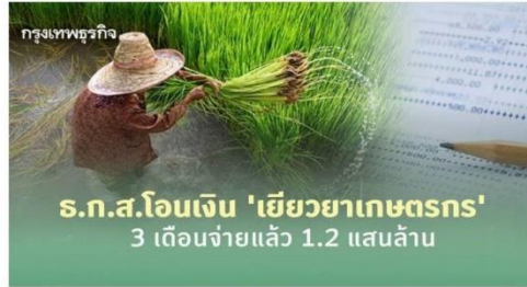
ธ.ก.ส.โอนเงิน "เยียวยาเกษตรกร" 77 ล้านราย ตามเป้าหมาย 3 เดือนจ่าย 1.2 แสนล้านบาท ระหว่างการพิจารณาตรวจสอบสิทธิอีก 269 ราย