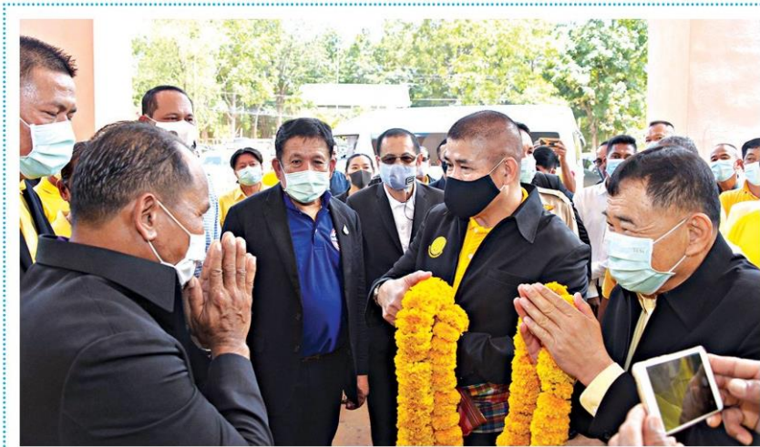
☑ แก้ไขปัญหา... ร.อ.ธรรมนัส พรหมเผ่า รัฐมนตรีช่วยว่าการกระทรวงเกษตรและสหกรณ์ พร้อมด้วย นายวิรัชศักดิ์ หวังศุภกิจโกศล รัฐมนตรีช่วยว่าการกระทรวงพาณิชย์ ลงพื้นที่ตรวจราชการพร้อมรับฟังปัญหาเรื่องที่ดิน ส.ป.ก. 4-01 และเรื่องโรคใบด่างมันสำปะหลัง ของพี่น้องเกษตรกร ณ ที่ว่าการอำเภอเลิงสาง จ.นครราชสีมา