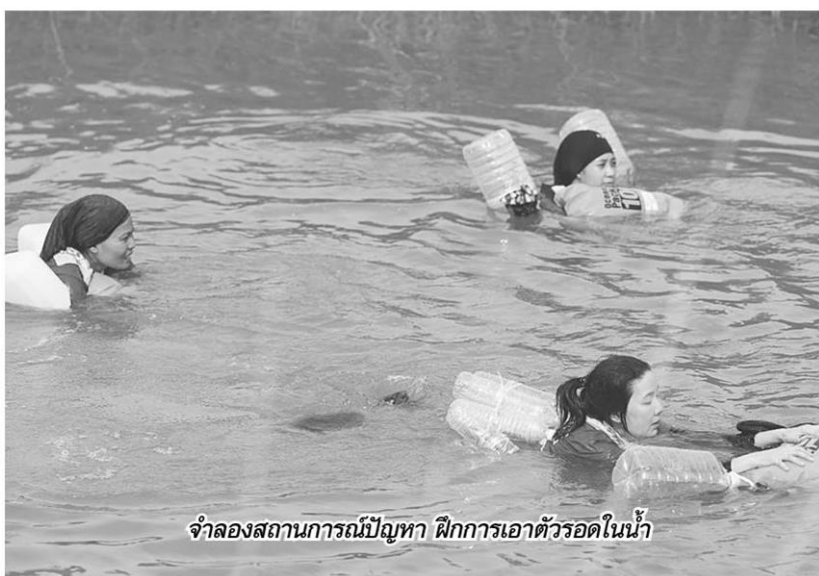
จำลองสถานการณ์ปัญหา ฝึกการเอาตัวรอดในน้ำ