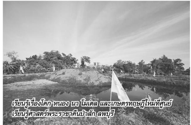
เรียนรู้เรื่องโคก หนอง นา โมเดล และเกษตรทฤษฎีใหม่ที่ศูนย์เรียนรู้ศาสตร์พระราชากิ่งปัก ลพบุรี

มันใจปรัชญาเศรษฐกิจพอเพียงเป็นทางรอดเดียว เห็นได้จากปีนังบัพพื้นที่ฟู โควิดของรัฐบาล 1.5 หมื่นล้าน มีลงมาทำโครงการ 1 ตำบล 1 กลุ่ม เกษตรทฤษฎีใหม่ ของกระทรวงเกษตรและสหกรณ์, โครงการพัฒนาพื้นที่ ต้นแบบพัฒนาคุณภาพชีวิตตามหลักทฤษฎีใหม่ประยุกต์ "โคก หนอง นา