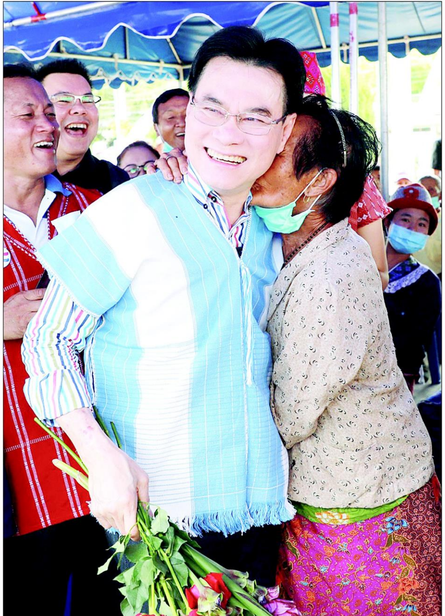
นายจรินทร์ ลักษณะวิศิษฎ์ รองนายกรัฐมนตรี และรัฐมนตรีว่าการกระทรวงพาณิชย์ พบปะและร่วมรับฟังปัญหาจากกลุ่มชาติพันธุ์ กะเหรี่ยง ที่อำเภออมก๋อย จังหวัดเชียงใหม่ พร้อมมอบอมก๋อยโมเดล แก่ปัญหาการค้าพืชผลทางการเกษตร

ขึ้น นายจรินทร์ระบุว่า เมื่อวานนี้มีโอกาสมานั่งคุยกับพวกเราที่ใต้ต้นมะเดื่อ 30-40 คน รับทราบว่ามีพี่น้องที่ปลูกมะเขือเทศมีปัญหา เพราะเวลาพี่น้องปลูกมะเขือเสร็จ ส่งไปขายเป็นเดือนแล้วยังไม่รู้ว่าจะเขือเทศได้ก็โลกริมละกับาท จะมารู้ทีหลัง ซึ่งไม่ยุติธรรม ดังนั้นต่อไปนี้การรับซื้อมะเขือเทศ จะต้องปิดป้ายราคาไว้ให้ชัดเจนทุกวัน ตนจะ