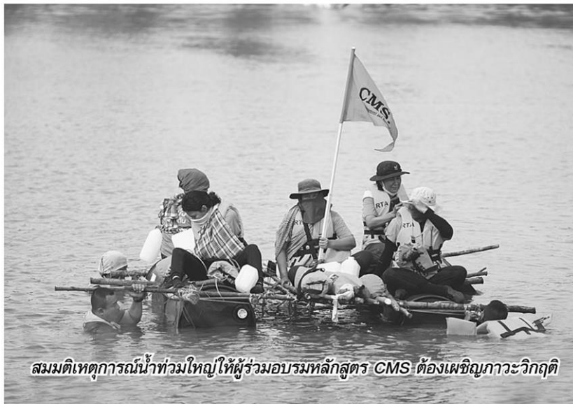
สมมติเหตุการณ์น้ำท่วมใหญ่ให้ผู้ร่วมอบรมหลักสูตร CMS ต้องเผชิญภาวะวิกฤติ

โมเดล" โดยกระทรวงมหาดไทย เกษตรกรจะมีรายได้มากขึ้น ไทยจะมี พื้นที่สีเขียวและแหล่งเก็บกักน้ำเพิ่มขึ้น นี่แสดงให้เห็นว่า โครงการพลัง คนสร้างสวรรค์โลกฯ เป็นต้นแบบให้รัฐบาล เพราะเป็นทางรอดที่ในหลวง รัชกาลที่ 9 ทรงทำตัวอย่างให้ดูทั่วประเทศ ปีหน้าครบปีที่ 9 เชื่อว่าจะ