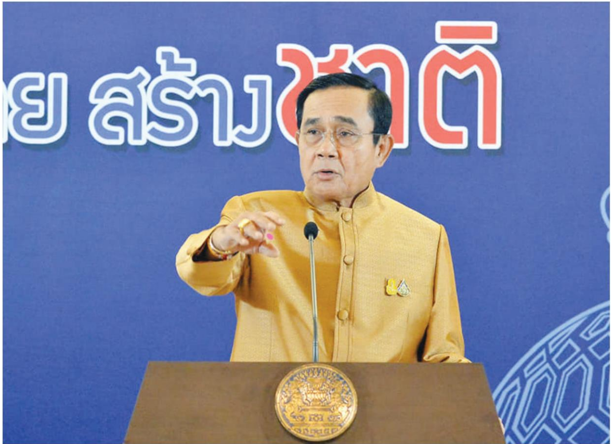
พล.อ.ประยุทธ์ จันทร์โอชา นายกรัฐมนตรี

ส่วนนี้ ดุลแลเศรษฐกิจอยู่อีกส่วนหนึ่ง แต่หากไม่มีเงินจำนวนนี้ก็จะลงไปสู่ระบบเศรษฐกิจผ่านโครงการที่คิดผ่านศูนย์บริหารสถานการณ์เศรษฐกิจ (ศบค.) ได้เพิ่มเติม