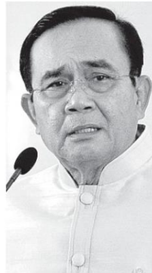
พล.อ.ประยุทธ์ จันทร์โอชา

จริงนั่นก็ว่ากันไปตาม กระบวนการตรวจสอบ แต่ไม่ใช่ปล่อยให้สื่อ ประโคมข่าวสะกิดทวง ถามกันซ้ำซากอย่างนี้ จะเสียเครดิตในภาพรวม รวมทั้งกับรัฐบาลที่ท่าน ผู้นำเชื่อมั่นในหลักการ ความโปร่งใสและตรวจ สอบเก่ง ตรวจสอบได้