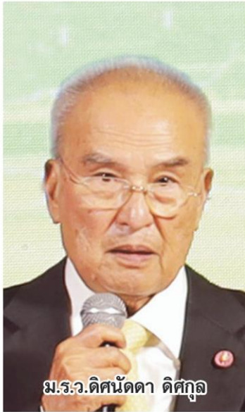
ม.ร.ว.ดิศนัดดา ดิศกุล

หัวข้อข่าว: ไม้อ้อ ไม้อดย พระราชดำริ ร.9 คำจูนสังคมไทย