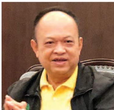
ทองเปลว กองจันทร์

ทองเปลว กองจันทร์ ปลัดกระทรวงเกษตรและสหกรณ์ กล่าวว่าการบริหารจัดการภาคการเกษตร หลังจากนี้จะยึดยุทธศาสตร์ 20 ปีเป็นหลัก แต่ต้องเร่งการทำงานให้เร็วขึ้นเพื่อให้สอดคล้องกับการเปลี่ยนแปลงของสถานการณ์โลก เริ่มจากตัวเกษตรกรเองที่เป็นจุดอ่อนสำคัญเนื่องจากเป็นแรงงานสูงวัย แต่มีทักษะสูง ดังนั้นต้องเข้าไปเสริมด้วยเทคโนโลยี