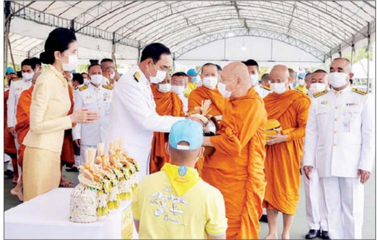
พล.อ.ประยุทธ์ จันทร์โอชา นายกรัฐมนตรีและรมว.กลาโหม พร้อมด้วย นางนราพร จันทร์โอชา ภริยา เป็นประธานพิธีบำเพ็ญกุศลและทำบุญตักบาตรพระสงฆ์ 89 รูป เนื่องในวันคล้ายวันสวรรคตพระบาทสมเด็จพระบรมชนกาธิเบศร มหาภูมิพลอดุลยเดชมหาราช บรมนาถบพิตร ที่สนามหลวง เมื่อเช้าวานนี้ (13ต.ค.)