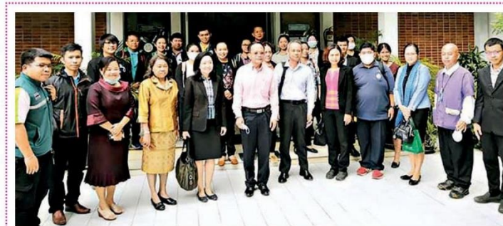
☒ ทำปฏิทินผลผลิต...นายฉกาจ ฉิมทิจระวัฒน์ ผอ.สำนักงานเศรษฐกิจการเกษตรที่ 4 เป็นประธานการประชุมชี้แจงการจัดทำปฏิทินผลผลิตสินค้าเกษตรรายเดือน ระดับจังหวัด เพื่อการบริหารจัดการด้านความมั่นคงทางอาหารและโภชนาการ ประจำปี 63 โดยมีเจ้าหน้าที่ผู้เกี่ยวข้องร่วมประชุม ณ ห้องประชุมสำนักงานเศรษฐกิจการเกษตรที่ 4 จ.ขอนแก่น

วันพุธที่ 4 พฤศจิกายน พ.ศ. 2563 ฉบับที่ : 25955 หน้า : 17(ล่าง)