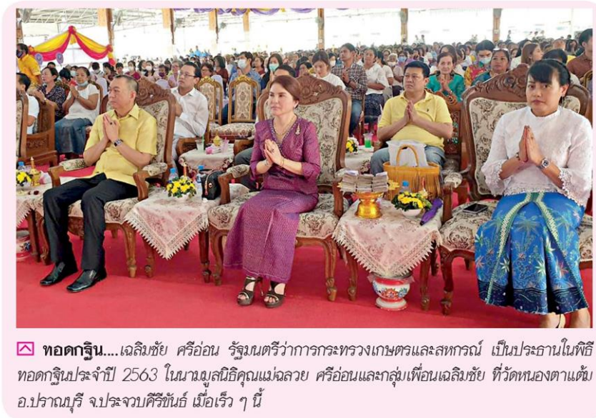
☑ ทอดกฐิน....เฉลิมชัย ศรีอ่อน รัฐมนตรีว่าการกระทรวงเกษตรและสหกรณ์ เป็นประธานในพิธีทอดกฐินประจำปี 2563 ในนามมูลนิธิคุณแม่กล้วย ศรีอ่อนและกลุ่มเพื่อนเฉลิมชัย ที่วัดหนองตาแต้ม อ.ปราณบุรี จ.ประจวบคีรีขันธ์ เมื่อเร็ว ๆ นี้