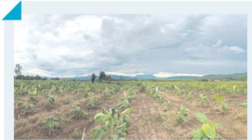
'รมว.เกษตรฯ' นำร่อง 'กล้วยหอมทอง' ต้นโครงการ 'ปลูกให้ใช้' ส่งออกญี่ปุ่น > 2

วันอังคารที่ 3 พฤศจิกายน พ.ศ. 2563 ฉบับที่ : 24410 หน้า : 1(บนซ้าย), 2