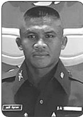
บัวขาว บัญชาเมฆ

จากสนามบินภูเก็ตเพื่อนำไปส่งให้สมาชิกสหกรณ์การเกษตร จังหวัดพะเยา ที่ได้ส่งข้าวหอมมะลิและมะม่วงจากสนามบิน