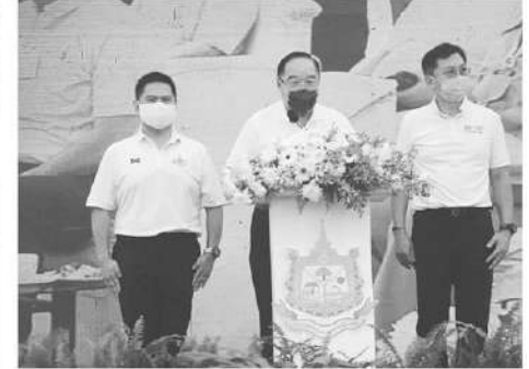
พลเอกประวิตร วงษ์สุวรรณ รองนายกรัฐมนตรี เป็นประธานประชุมเชิงปฏิบัติการเพื่อสรุปผลและถอดบทเรียน (After Action Review : AAR) การป้องกันและแก้ไขปัญหาหมอกควันภาคเหนือ ปี 2563 เมื่อวันที่ 19-21 พ.ค.ที่ผ่านมา ณ จ.เชียงใหม่

ไร่ หรือ 20% เท่านั้น อีก 80% ดูแลไม่ได้ อีกทั้งเจ้าหน้าที่ดับไฟป่ามีอาชีพแทบไม่มี มีแต่จิตอาสา อสม. เข้าไปปฏิบัติหน้าที่ดับไฟป่า หลายครั้งเกิดความสูญเสีย การแก้ปัญหาหมอกควันล้มเหลวเกิดจากระบบ โจทย์สำคัญจะอย่างไรให้ 80% ที่เหลือนี้มีการดูแล พื้นที่เหล่านี้มีองค์การปกครองส่วนท้องถิ่นรับผิดชอบ แต่ความจริงถ่ายโอนอำนาจมา โดยผู้รับมอบไม่มีความพร้อมและไม่มีความงบประมาณ บาง อบท. โดน สตง.ตรวจสอบงบประมาณไฟป่า แต่เราก็ช่วยประสาน มีประชุมปลดล็อกปัญหานี้ในรูปแบบวงจกลมเชียงใหม่มี 220 อบท.ที่มีพื้นที่อยู่ในป่า 110 แห่ง หากไม่มีความพร้อม การจัดการไฟป่าและหมอกควันไม่สำเร็จแน่นอน" วิทยา กล่าว