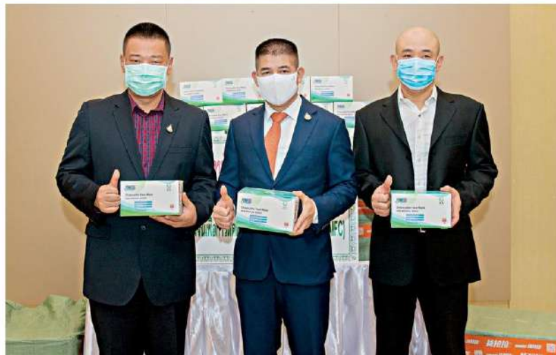
☑ รับมอบหน้ากาก...ร.อ.ธรรมนัส พรหมเผ่า รัฐมนตรีช่วยว่าการกระทรวงเกษตรและสหกรณ์ รับมอบหน้ากากอนามัยจาก สมาคมจีนเพื่อการติดต่อระหว่างประเทศที่เป็นมิตร China Association for International Friendly Contact (CAIFC) 20,000 ชิ้น ณ กระทรวงเกษตรและสหกรณ์ ตามราชดำริ