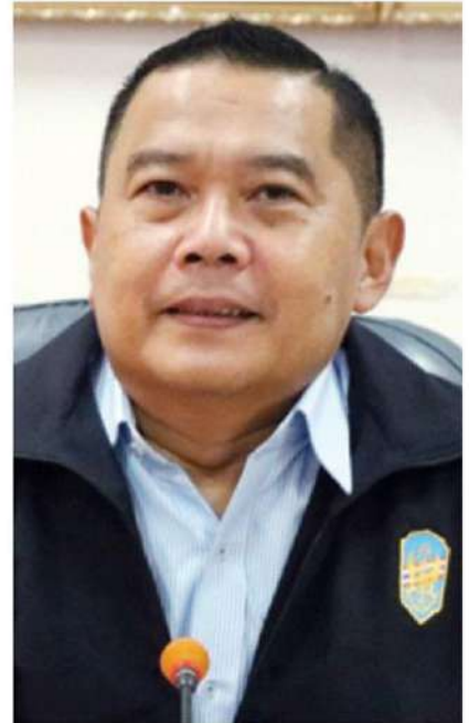
เข้มแข็ง ยุติธรรมดำรง