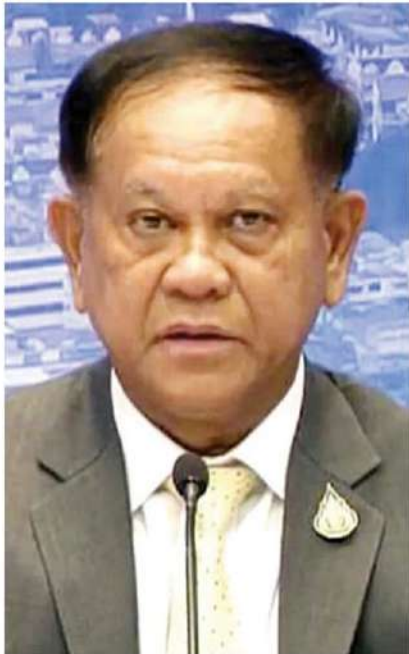
พล.อ.สมศักดิ์ รุ่งสิตา