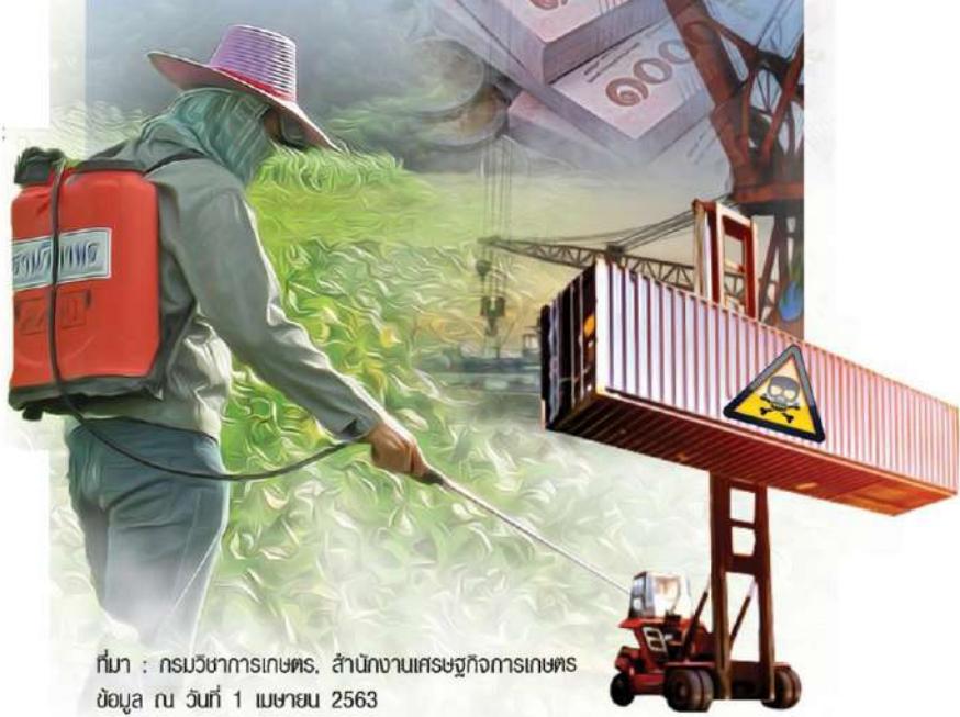
ข้อมูล ณ วันที่ 1 เมษายน 2563