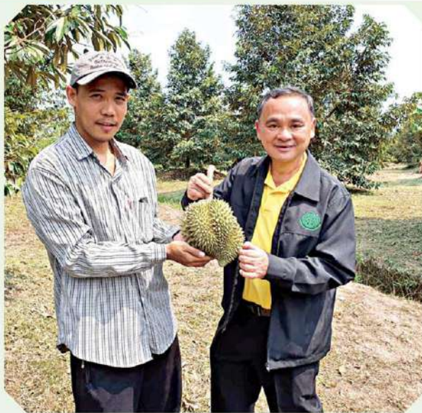
เกษตรกรผู้ปลูกทุเรียนแปลงใหญ่จังหวัดตราด ตามมาตรฐานการปฏิบัติทางการเกษตรที่ดี (GAP) สำหรับพืชอาหาร(มกษ.9001-2556)

ตามที่กระทรวงเกษตรและสหกรณ์ มีนโยบายในการส่งเสริมการเกษตรแบบแปลงใหญ่ เพื่อมุ่งหวังสร้างความเชื่อมั่นให้กับผู้บริโภคถึงคุณภาพผลผลิตจากภาคเกษตรไปพร้อมกับการเพิ่มช่องทางการตลาดให้กับเกษตรกรไทย ให้มีโอกาสและมีรายได้มากขึ้น สำนักงานมาตรฐานสินค้าเกษตรและอาหารแห่งชาติ (มกอช.) ในฐานะหน่วยงานหลักในเรื่องมาตรฐานสินค้าเกษตรและอาหารแห่งชาติ จึงได้ดำเนิน “โครงการพัฒนาศักยภาพเกษตรกรผู้ปลูกทุเรียนในพื้นที่เกษตรแปลงใหญ่ภาคตะวันออก ให้ได้รับการรับรองมาตรฐานการปฏิบัติทางการเกษตรที่ดี (GAP) สำหรับพืชอาหาร (มกษ.9001-2556) ปี 2563”