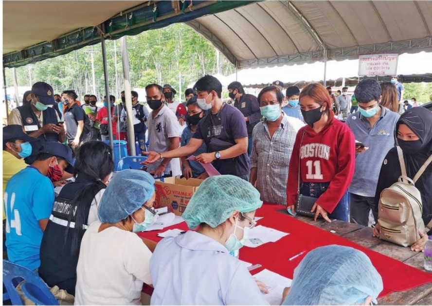
ตรงข้าม - เจ้าหน้าที่ด่านควบคุม อ.สิเกา จ.ตรัง ตรวจคัดกรองอย่างเข้มงวด โดยเฉพาะกลุ่มแรงงานที่เดินทางมาจาก จ.ภูเก็ต พบผู้ติดเชื้อจำนวนกว่า 10 ราย จึงส่งไปตรวจที่โรงพยาบาล และเข้าสู่กระบวนการกักตัวต่อไป เมื่อวันที่ 4 พ.ค.

วันอังคารที่ 5 พฤษภาคม 2563 ฉบับที่ : 10752 หน้า : 1(ขา), 7, 12