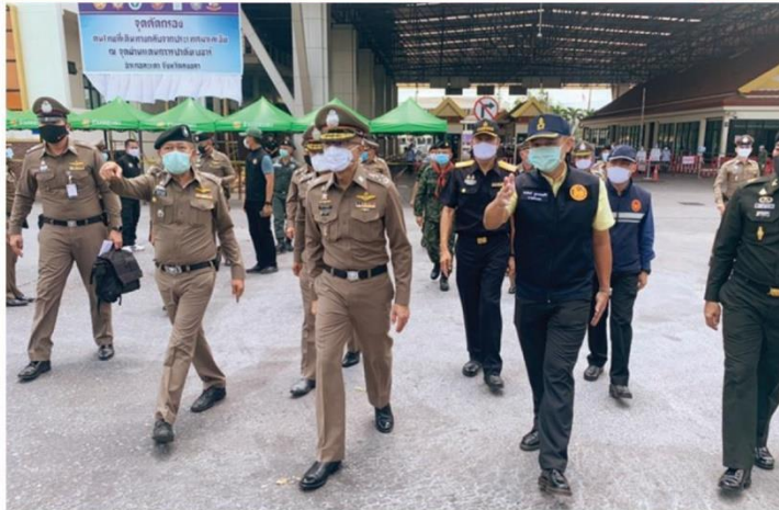
△ ตรวจด่าน - พล.ต.อ.สุวัฒน์ แจ้งยอดสุข รองผบ.ตร. พร้อมคณะตรวจเยี่ยมการปฏิบัติ หน้าที่ของด่านตรวจคนเข้าเมืองป่าดงเบขาร์ อ.เสเดา จ.สงขลา และมอบนโยบายการป้องกันกา แพร่ระบาดของเชื้อโควิด เมื่อวันที่ 4 พ.ค.

● ฮี้มทบทวน ต่อจากหน้า 1 โควิดมากขึ้น พร้อมขึ้นชั้นคลินิกเวชกรรม เสริมความงามยังเปิดไม่ได้ อยู่กลุ่มเดียว โรคมรศพ ผับบาร์ ขณะที่ตร.จับกุมมั่วสุมนกิน เหล้า เสพฯ เล่นพนันในเคหสถานกินเดียว 129 ราย คลังสั่งเปลี่ยนพื้นที่ลงทะเบียน อุทธรณ์ จากหนักตรวจเป็นกรมประชา สัมพันธ์ พร้อมโอน 5 พัน อีก 3 ล้านคน ทย เงินกู้ขาดแรก 7 หมื่นล้านได้แล้ว ขณะที่ขยาย