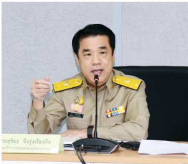
พัฒนาอุตสาหกรรม ตั้งธงสร้างรายได้4.5ล้านล้านบาท