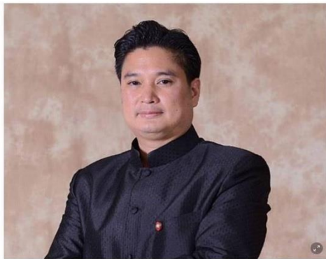
สศก. สนองมาตรการรัฐเข้มข้น ป้องแพร่ระบาดเชื้อไวรัสโควิด-19 นำร่อง ชรก.ทำงานที่บ้าน นำ งานมีประสิทธิภาพ ไม่กระทบผู้ผลิตธัญพืช