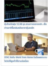
DTAC SoftU Work from Home สนับสนุนระบบโควิดให้ลูกค้าใช้งานต่อเนื่อง

-อินโฟเควสท์ โดย นิสารัตน์ วิจิตรพงศ์/วิสาขา โทร.02-2535000 ต่อ 317 อีเมล: rachada@infoquest.co.th--