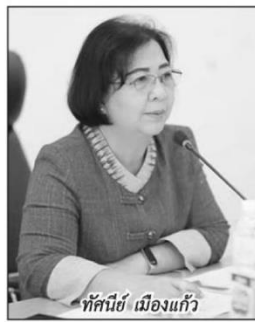
ทัศนีย์ เมืองแก้ว

ทั้งนี้ การดำเนินงานดังกล่าว จะนำไปสู่การสร้างความเข้มแข็งให้แก่เกษตรกรและสถาบันเกษตรกร โดยการลดต้นทุนโลจิสติกส์สินค้าเกษตร ลดการสูญเสียของผลผลิต และรักษาคุณภาพผลผลิต ตั้งแต่การจัดการในฟาร์มของเกษตรกรผ่านสถาบันเกษตรกรไปสู่การส่งมอบหรือขนส่งผลผลิตให้แก่ผู้ประกอบการและผู้บริโภค เพื่อสร้างความเชื่อมั่นและความพึงพอใจ ทั้งในด้านคุณภาพผลผลิตสินค้าเกษตรและระยะเวลาในการให้บริการที่รวดเร็ว