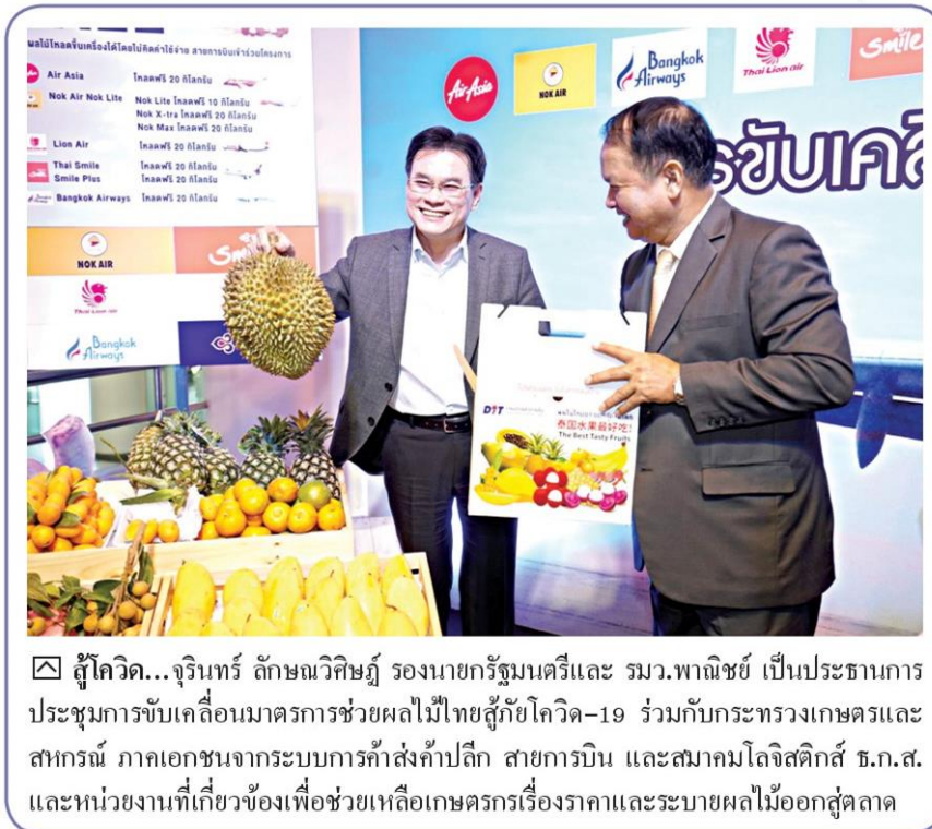
☑️ สู้โควิด... จุรินทร์ ตักษณวิศิษฏ์ รองนายกรัฐมนตรีและ รมว.พาณิชย์ เป็นประธานการประชุมการจับเค้เลื่อนมาตรการช่วยผลไม้ไทยสู้ภัยโควิด-19 ร่วมกับกระทรวงเกษตรและสหกรณ์ ภาคเอกชนจากระบบการค้าส่งค้าปลีก สายการบิน และสมาคมโลจิสติกส์ ช.ก.ส. และหน่วยงานที่เกี่ยวข้องเพื่อช่วยเหลือเกษตรกรเรื่องราคาและระบายผลไม้ออกสู่ตลาด