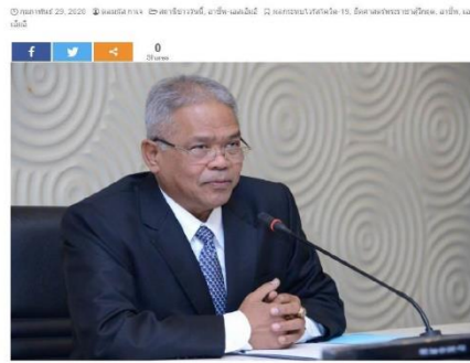
อนันต์ อนันตผล

กระทรวงเกษตร รม.อานันท์ อนันตผล รม.เกษตรฯ กล่าวถึงผลกระทบของไวรัสโควิด-19 ที่ส่งผลกระทบต่อภาคเกษตร โดยระบุว่า ภาคเกษตรสามารถรองรับผลกระทบจากวิกฤติเศรษฐกิจได้ แม้จะเผชิญกับผลกระทบจากไวรัสโควิด-19 ที่ส่งผลกระทบต่อภาคเศรษฐกิจอื่น ๆ แต่ภาคเกษตรยังสามารถผลิตและจำหน่ายสินค้าเกษตรได้ตามปกติ