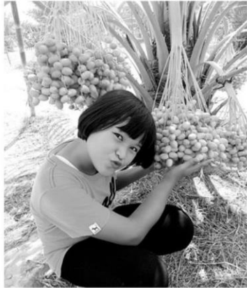
อินทผลัม

ทั้งนี้สำนักงานเศรษฐกิจการเกษตร ระบุว่ามีการส่งเสริมพืชอาหารอนาคต (Future Crops/ Food) ซึ่งเป็นพืชเศรษฐกิจใหม่เพื่อยกระดับมูลค่าสินค้าเกษตรให้สูงขึ้น อาทิ 1. สินค้าเกษตรที่มีศักยภาพทางการตลาดในอนาคต อาทิ กาแฟ โกโก้ แมคคาเดเมีย ฟิก (Fig) และ