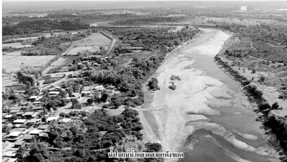
น้ำในแม่น้ำหลายสายแห้งขอด

รอดได้ อย่างผมเองทำเกษตรในพื้นที่ 100 ไร่ ที่ อ.แจ้ห่ม จ.ลำปาง แต่ก่อนปลูกส้มโชกุน แต่ประสบปัญหาเรื่องน้ำ จึงปรับเปลี่ยนมาทำ ปศุสัตว์ เลี้ยงควายแทน และปลูกไม้ผลต่างๆ ไม่ว่าจะเป็ส้มโอ มะม่วงพันธุ์ชาวนิยม และปลูกไผ่”