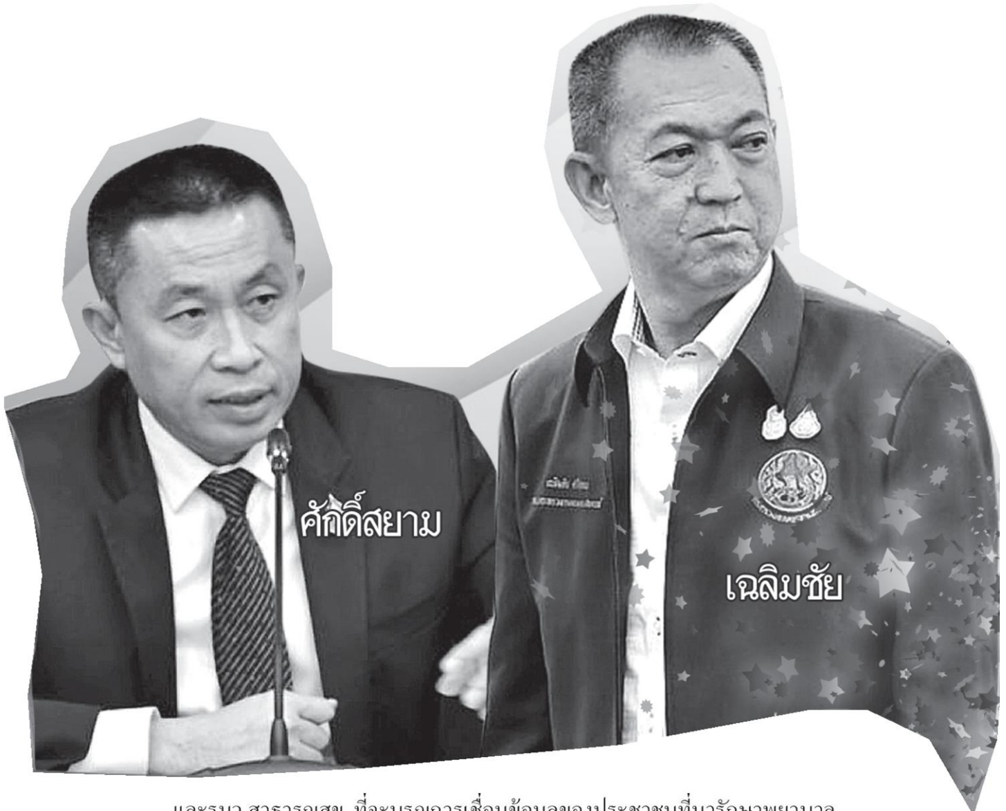
ศักดิ์สยาม