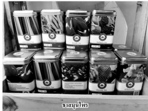
ชาสมุนไพร

เกษตรกรแข่งขันกัน ถ้ารัฐบาลยังไม่ออกมาตรการอะไรมา จะเกิดปัญหาหลายด้าน อย่างเช่น กำลังซื้อของคนเศรษฐกิจฐานรากจะอ่อนแรง เนื่องจากผลผลิตไม่ดี และราคาพืชผลจะไม่ดีไปด้วย อย่างไรก็ตามที่ผ่านมารัฐบาลอัดฉีดเงินเพื่อเพิ่มกำลังซื้อของประชาชนก็เป็นการช่วยมาได้ระดับหนึ่ง แต่ในเชิงเศรษฐกิจมีผลไม่มากนัก และไม่แก้ปัญหามาอย่างยั่งยืน