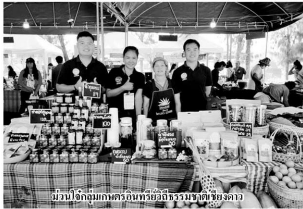
ม่วนใจ๋กลุ่มเกษตรกรอินทรีย์วิถีธรรมชาติ เชียงดาว

ฝนน้ำท่วม น้ำไหลหลาก หน้าแล้งก็แล้งขาดน้ำ ต้องขุดบ่อในไร่นา เพื่อรองรับน้ำในฤดูฝนที่หลากและลดการเกิดอุทกภัย พอหน้าแล้งก็มีน้ำไว้ใช้อย่างต่อเนื่อง เป็นการวางแผนการใช้น้ำ จึงต้องแนะนำให้เกษตรกรมีแหล่งน้ำของตัวเอง เป็นการนำหลักปรัชญาเศรษฐกิจพอเพียงของในหลวง ร.9 ที่พระราชทานไว้ในเรื่องของเกษตรทฤษฎีใหม่มาใช้ ซึ่งต้องแบ่งพื้นที่ส่วนหนึ่งประมาณ 30 % ไว้เป็นแหล่งน้ำ ไว้ปลูกข้าว เลี้ยงปลา ปลูกไม้ยืนต้นไม่ต้องไปซื้อ